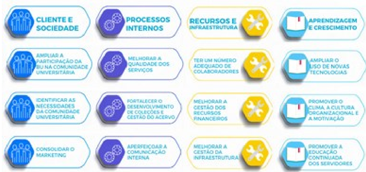
Figura 1 - Planejamento Estratégico BU/UFSC 2019/2020