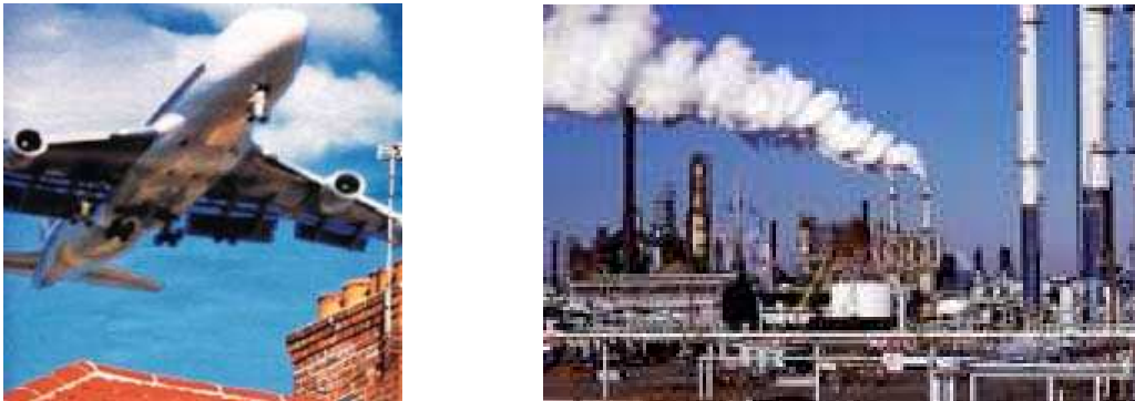
FIGURA 1 – Ruído industrial e urbano

Com a revolução industrial, a produção se tornou prioridade, e o homem nunca mais conseguiu melhorar o ambiente que habita. Com o desenvolvimento tecnológico no século XX, ou seja, com a introdução do rádio e do amplificador na década de 20, o aparecimento do automóvel e o desenvolvimento da aviação militar, houve um incremento do ruído na zona urbana. A partir dos anos 50 houve o crescimento descontrolado da industrialização, com o automatismo e o acúmulo de máquinas (NEWTON, 2001), contribuindo aceleradamente para o ruído nos grandes centros (Figuras 1 e 2). Algumas pesquisas indicam que o ruído que nos rodeia duplica a cada 10 anos (FERNANDES, 2003).