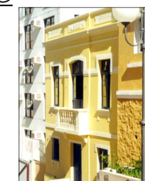
Teatro da Ubrou