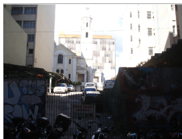
Foto a partir da rua Trajano, vista do terreno e Catedral ao fundo.

Esses foram os principais motivos que levaram à escolha do terreno, considerando-se que a Casa de Cultura só teria a oferecer para a cidade, à medida em que se revitaliza regiões da cidade com áreas de uso público que se integram às edificações existentes.