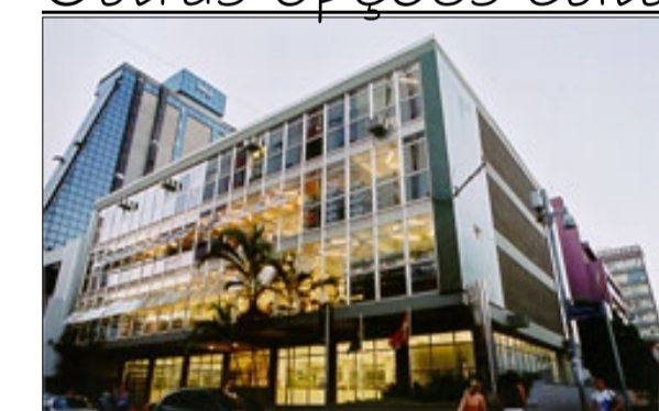
Biblioteca Pública de Santa Catarina