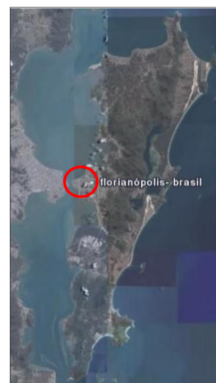
Mapa de Florianópolis