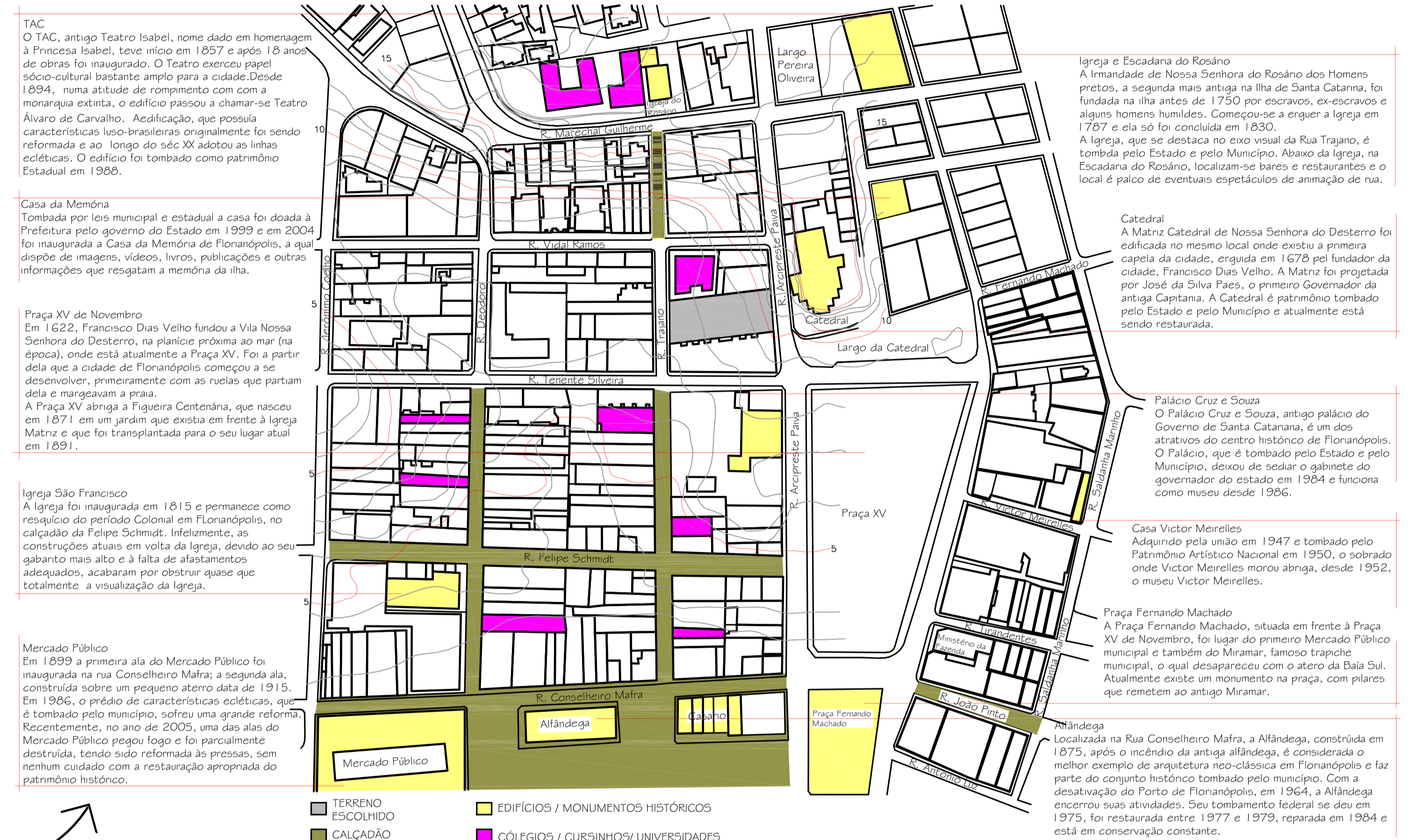
Mapa de inserção urbana: Mapeamento das edificações históricas do entorno, usos mais significativos para a pesquisa e espaços públicos.