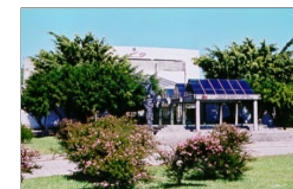
CIC - Centro Integrado de Cultura