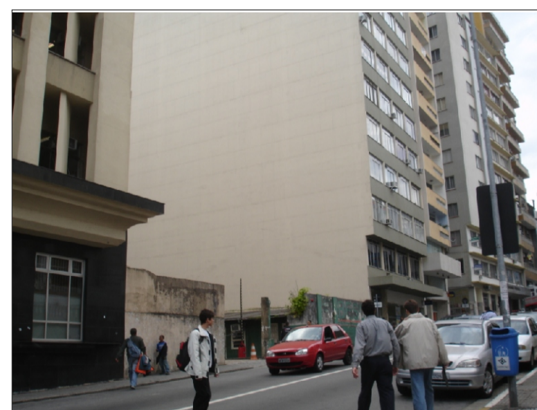
Foto da rua Arcipreste Paiva, vista da rua e do terreno.