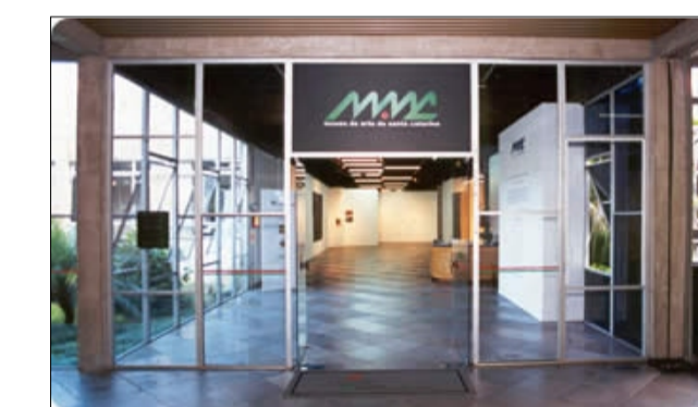
CIC - Museu de Arte de Santa Catarina