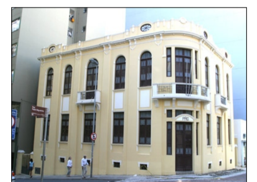
Casa da Memória