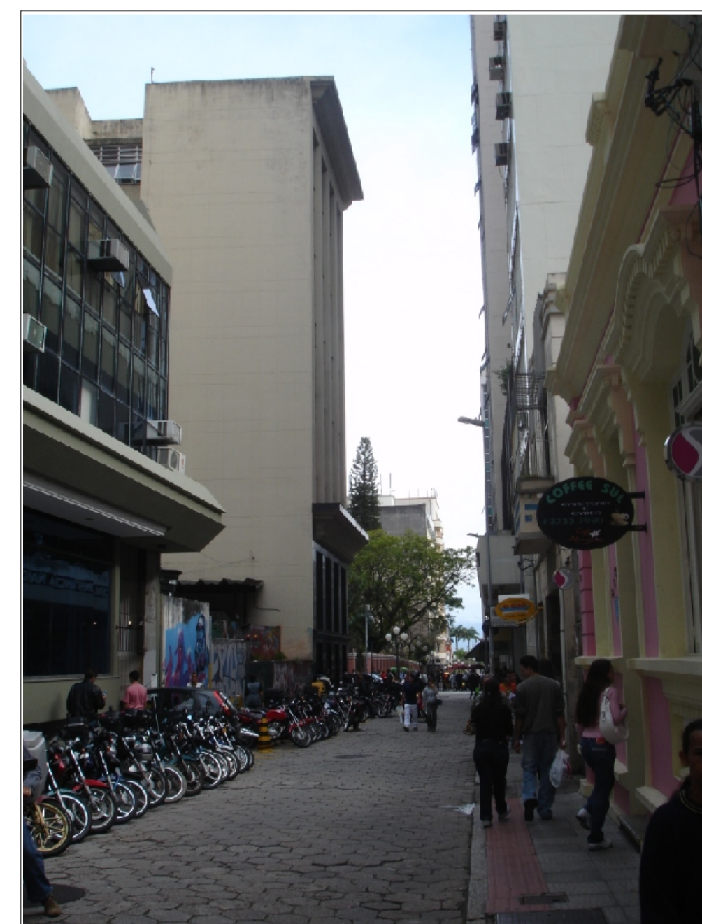
Foto da rua Trajano, vista das edificações do entorno.