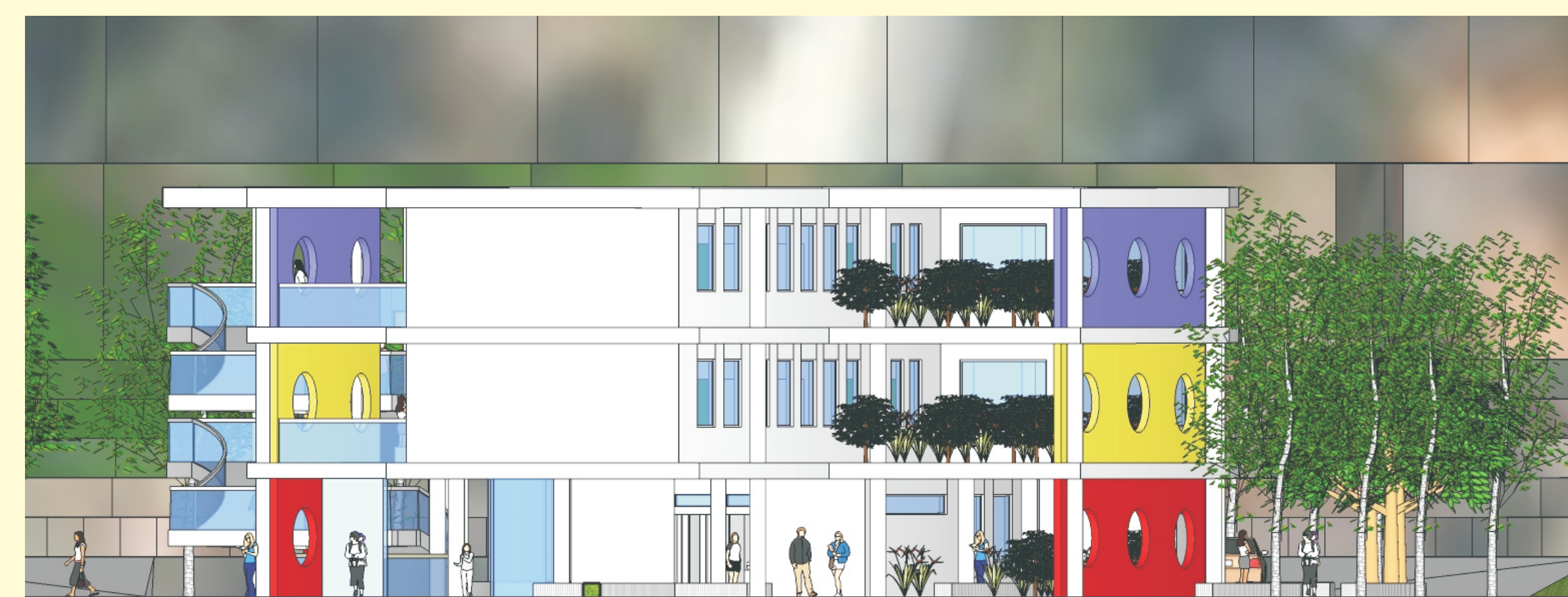
FACHADA NOROESTE ESCALA 1/125