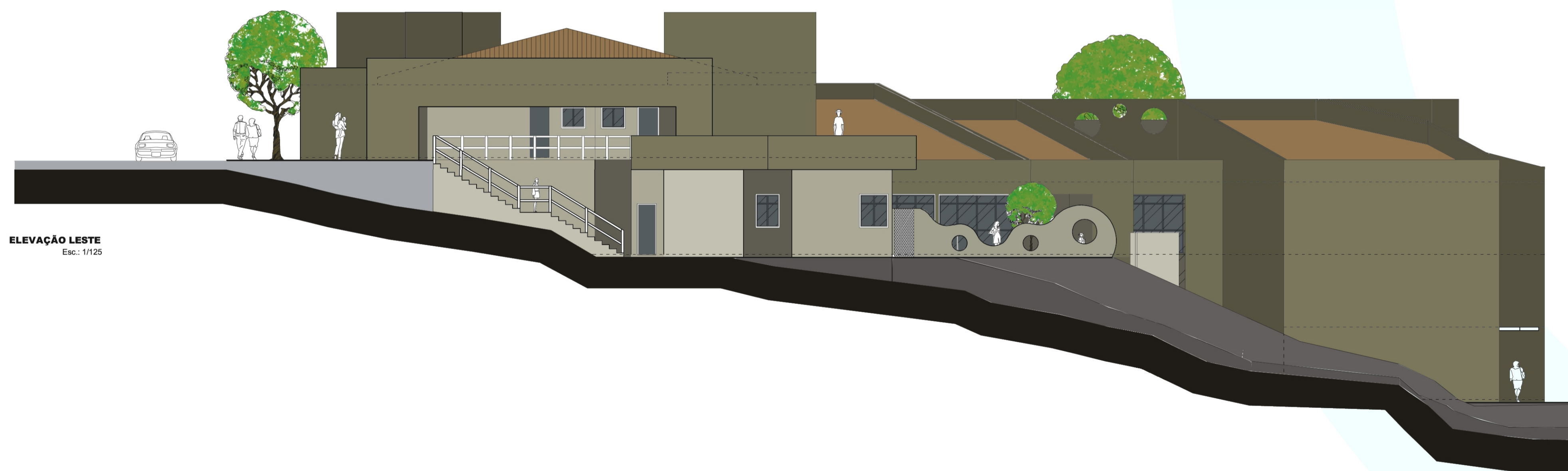
ELEVÇÃO LESTE Esc.: 1/125

LAJE COBERTURA - ADMINISTRAÇÃO / ACESSO SOCIAL NÍVEL 13,10 m PRIMEIRO PAVIMENTO - ADMINISTRAÇÃO / ACESSO SOCIAL NÍVEL 10,10 m TÉRREO - SERVIÇOS NÍVEL 6,10 m