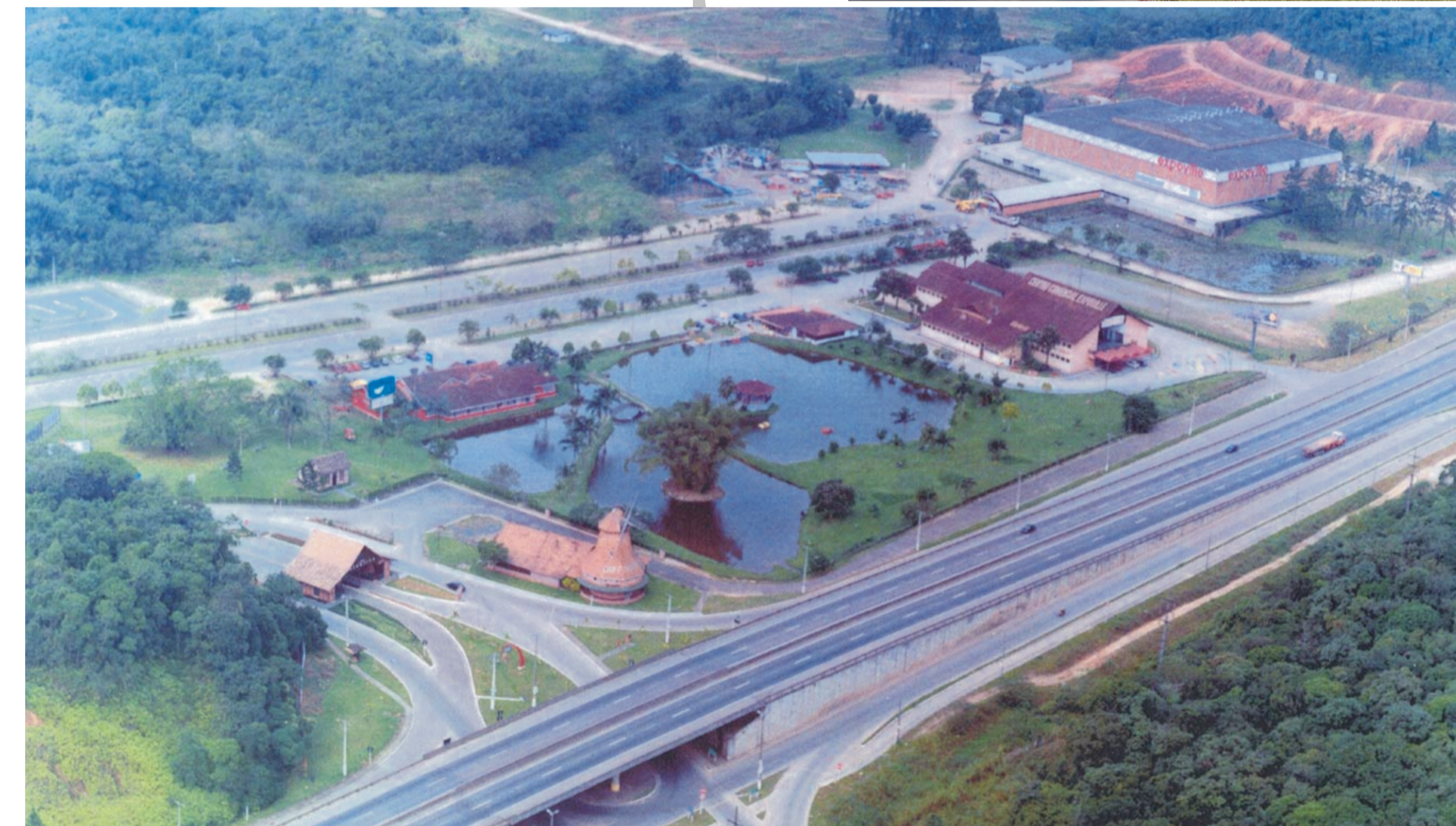
Vista Geral do Parque