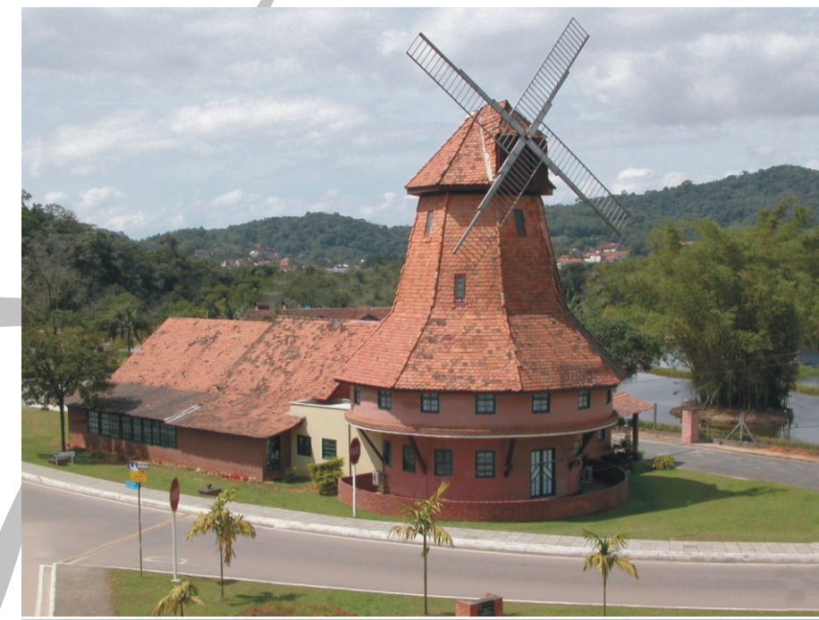
Moinho de vento