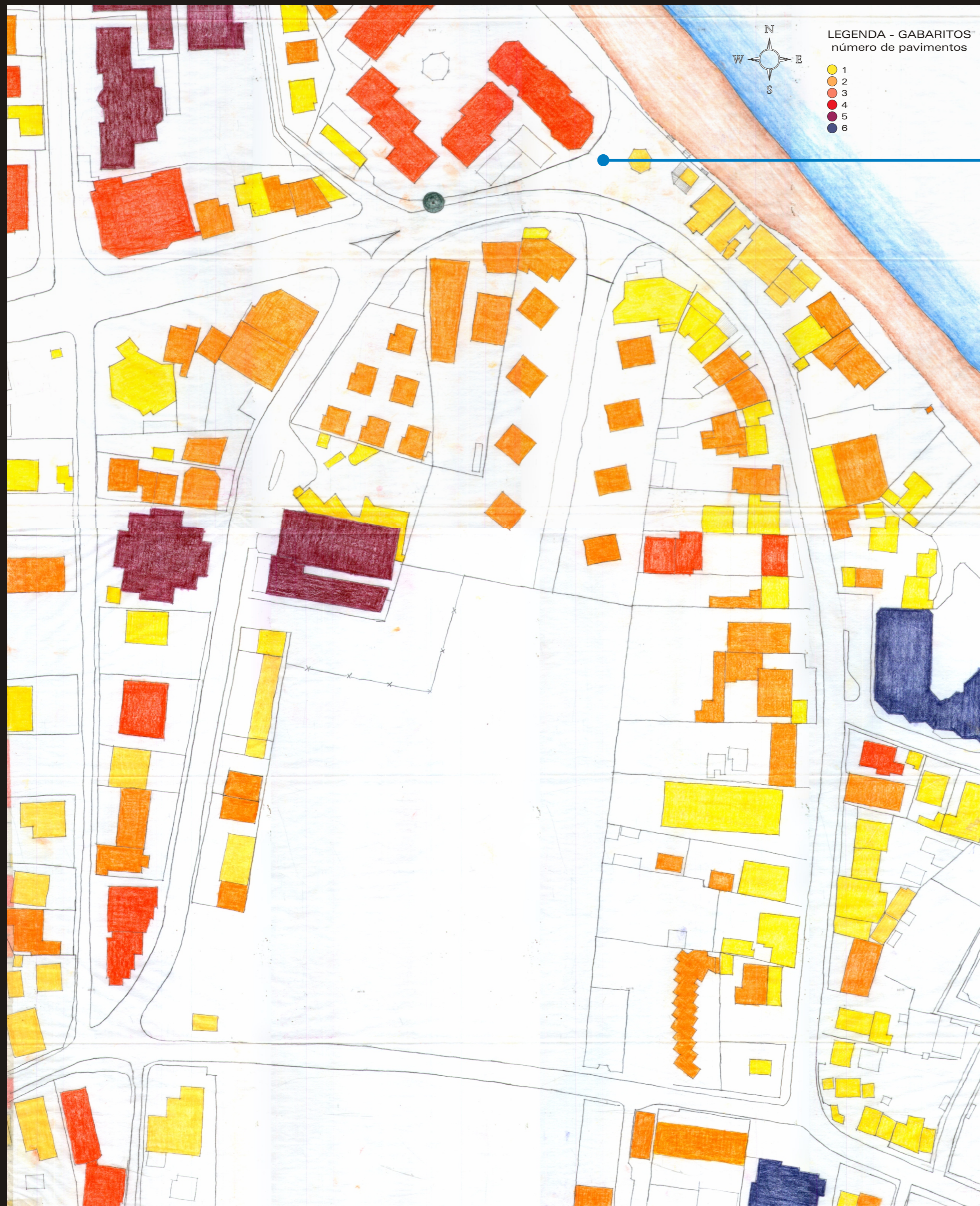
USOS E GABARITOS - Área Central ESCALA: 1/500