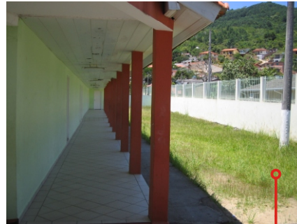
Abandono das áreas externas

Abaixo sala de aula e ao lado, refeitório