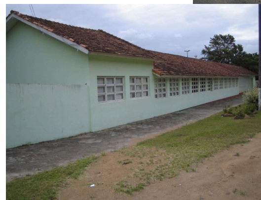
Fotos da Escola Estadual Básica Laura Lima