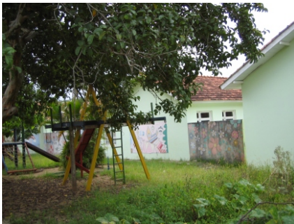
Fotos da Escola Estadual Básica Laura Lima

O terreno da escola conta com uma área boa, porém os espaços externos encontram-se descuidados e não possuem um bom planejamento. As áreas verdes, que como foi visto anteriormente, são indispensáveis na formação das crianças, são aqui, deixadas em segundo plano.