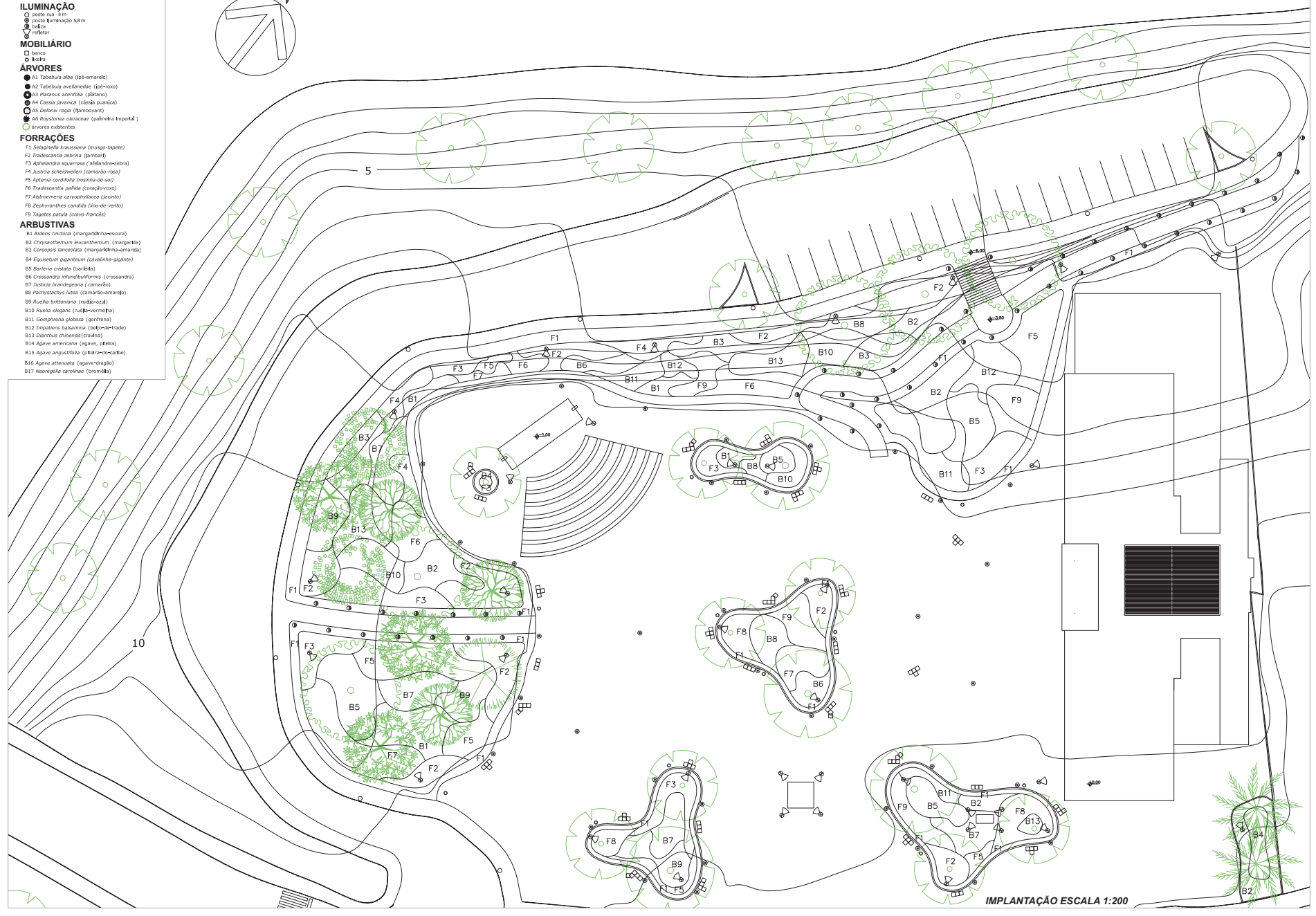
IMPLANTAÇÃO ESCALA 1:200