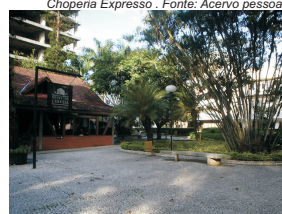
Choperia Expresso.