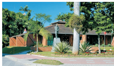
Mausoléu Dr. Blumenau.