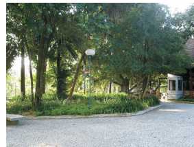
Praça Hercílio Luz.