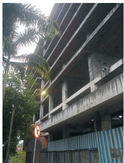
Lateral do Edifício América.