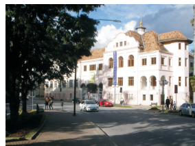
Lateral do Edifício América.