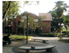
Choperia Expresso.