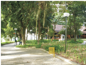
Praça Hercílio Luz e árvores existentes no local. Aos fundos, o Museu da Cerveja.