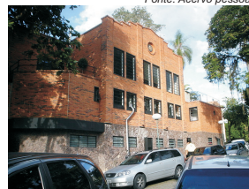
Deck da Choperia Expresso e estacionamento.