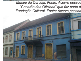
Museu da Cerveja. Fonte: Acervo pessoal. "Casarão das Oficinas" que faz parte da Fundação Cultural. Fonte: Acervo pessoal.