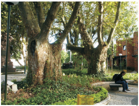
Praça Hercílio Luz e árvores existentes no local. À direita pode-se ver o Choperia Expresso.