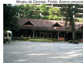
Museu da Cerveja.