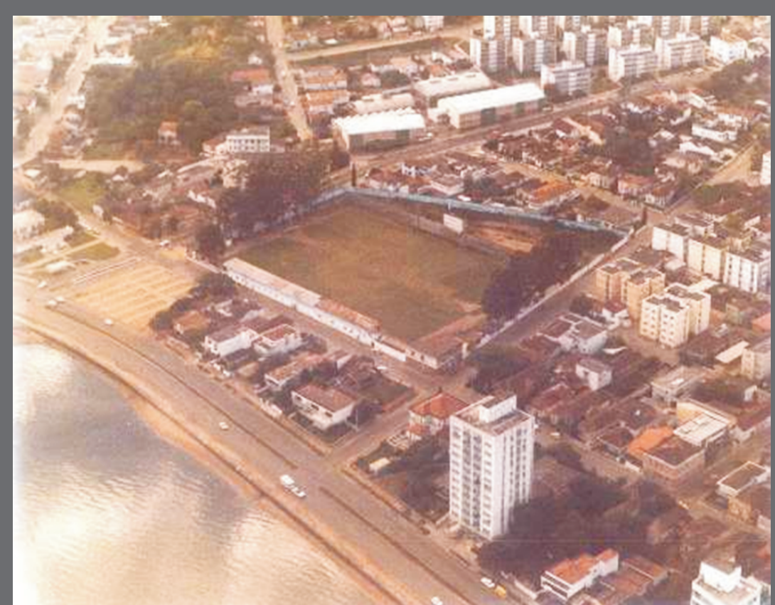
Av Beiramar Norte e Campo da Liga, década de 70