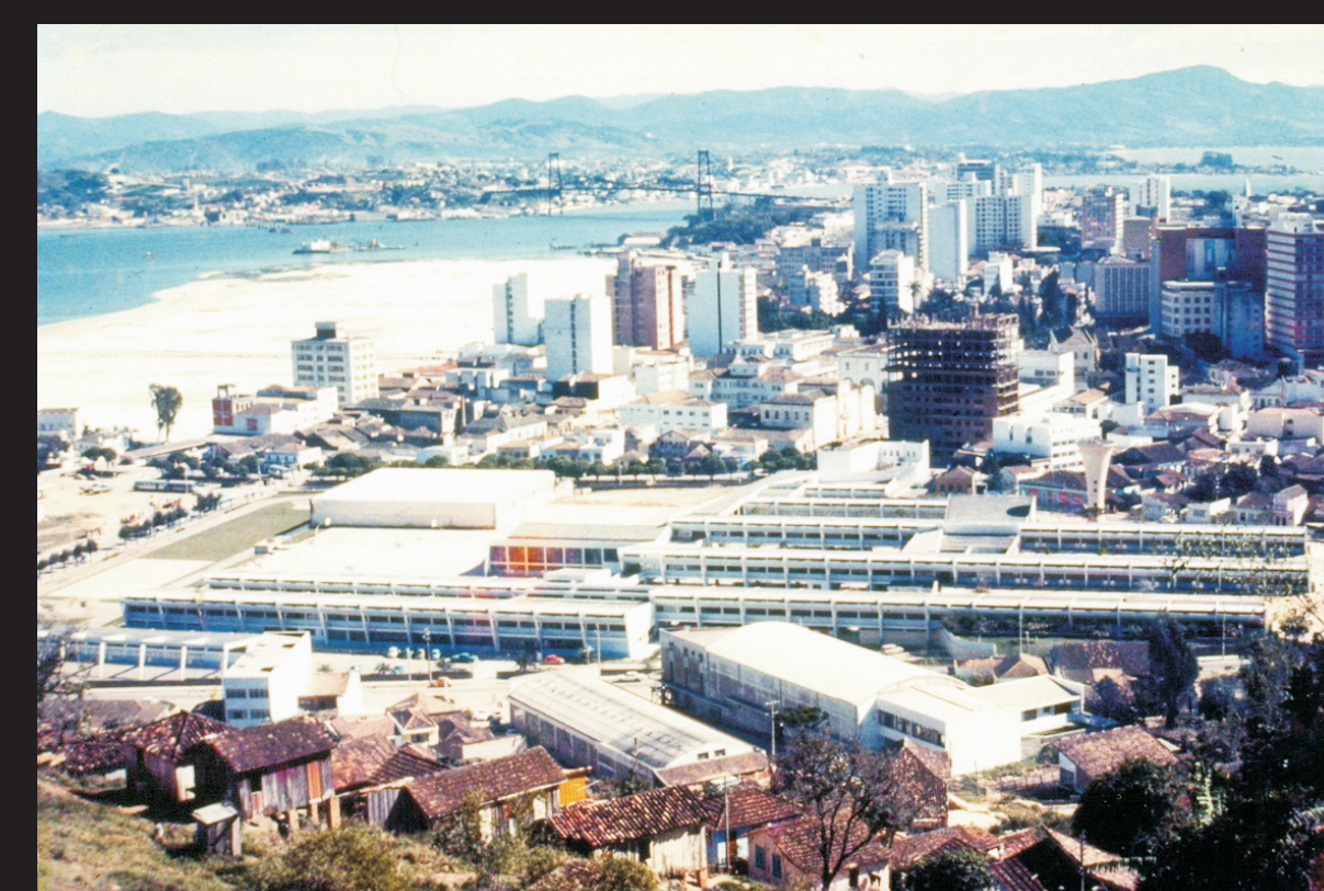
Instituto Estadual de Educação, década de 70, Casa da Memória