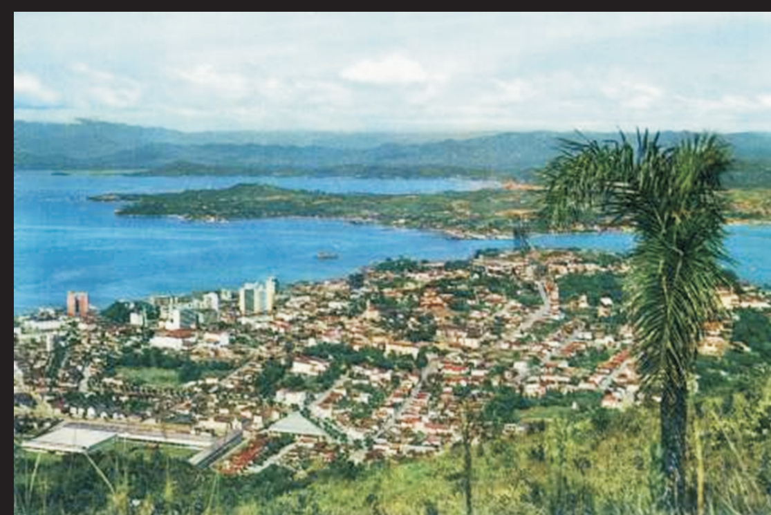
Vista a partir do Morro, Casa da Memória