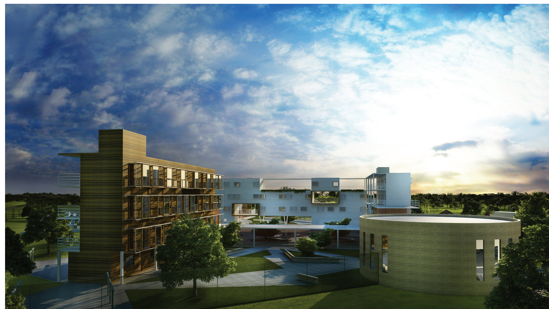
Interação entre o Regime Aberto e o Regime Semi-Aberto.

Conforme visto em “Legislações”, o estabelecimento precisa ter creche para crianças até 7 anos. Dessa forma, buscou-se criar um espaço para as mães criarem seus filhos fora do ambiente prisional. O primeiro pavimento conta com celas do Regime Semi-Aberto, o qual possui apenas relação visual com a maternidade.