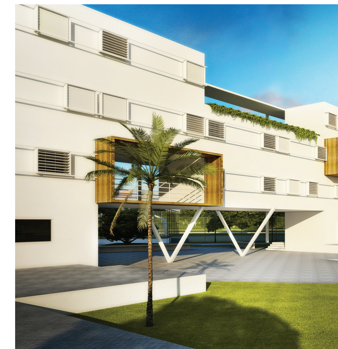
Perspectiva Regime Semi-Aberto.

A disposição do objeto construído também foi pensada através de espaços de contemplação em meio as celas, criando espaços para o primeiro pavimento em frente das celas para o primeiro pavimento em frente das celas, o qual possui maior contato com a cidade que as cerca e com a natureza.