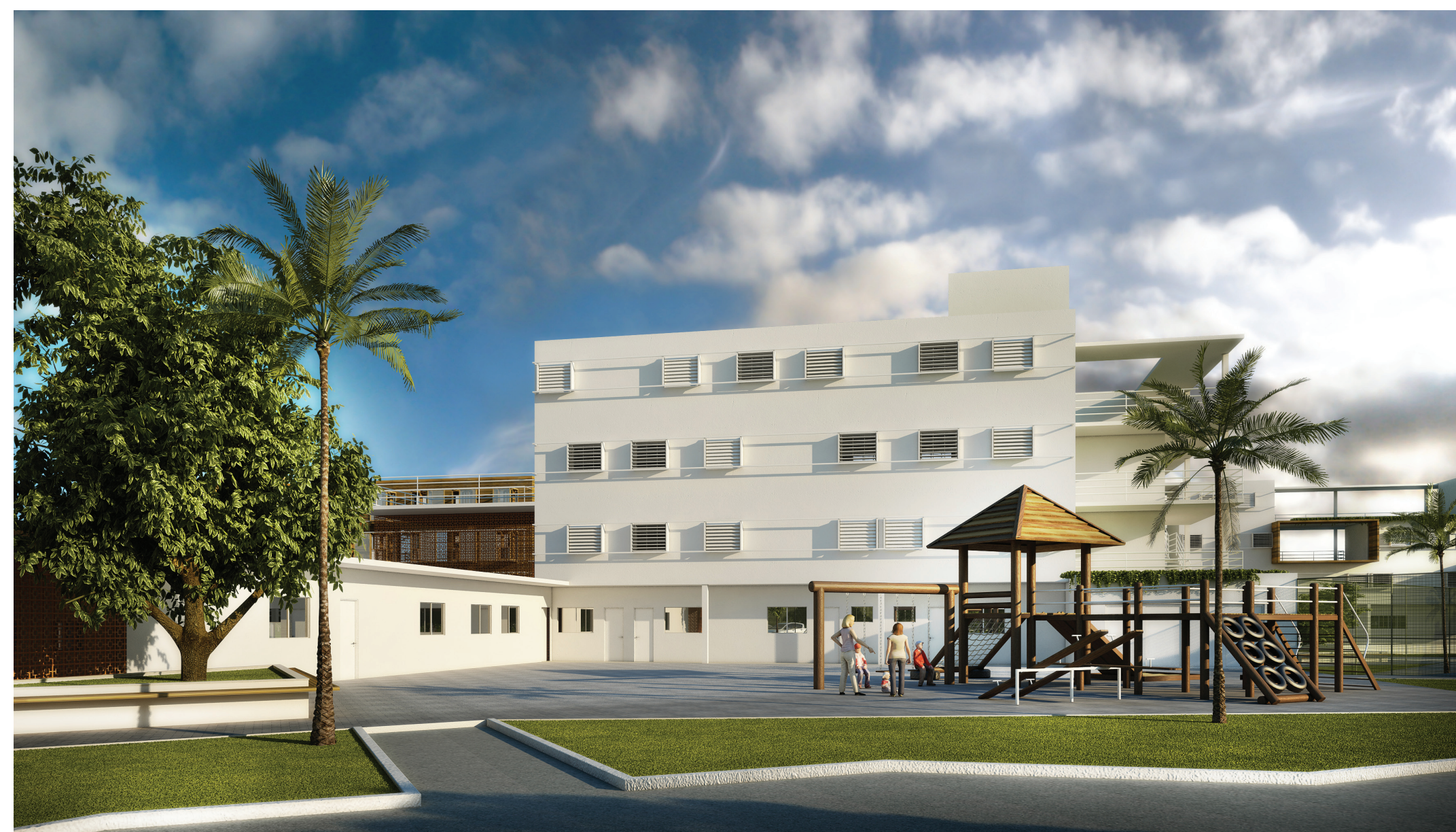
Perspectiva Espaço Maternidade.

Conforme visto em “Legislações”, o estabelecimento precisa ter creche para crianças até 7 anos. Dessa forma, buscou-se criar um espaço para as mães criarem seus filhos fora do ambiente prisional. O primeiro pavimento conta com celas do Regime Semi-Aberto, o qual possui apenas relação visual com a maternidade.