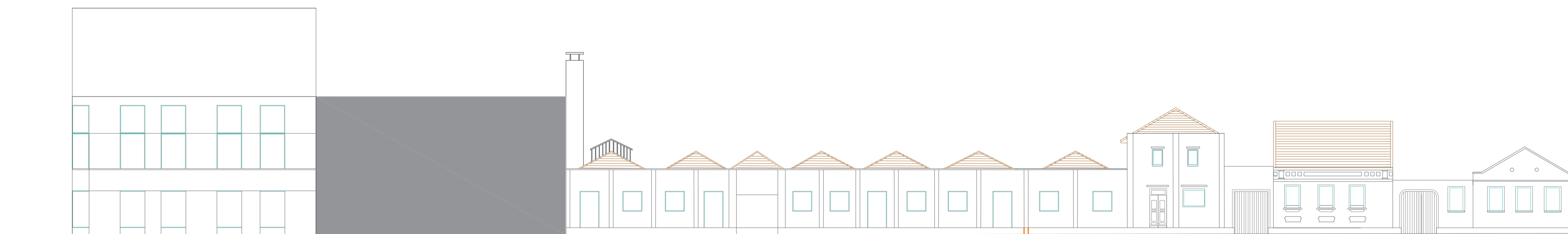
FACHADA RUA XV DE NOVEMBRO ESCALA 1/200

Para a nova fachada buscou-se manter o alinhamento da esquina através de uma sacada que também serve como alinhamento em relação a altura da platibanda da antiga indústria. Combinou-se a altura do volume da platéia com o gabarito da edificação entre Teatro e o Centro de Vivência, deixando a caixa cênica de maior altura mais ao fundo. Para romper com parte dos planos verticais foram inseridos pórticos inclinados que marcam os cheios e vazios