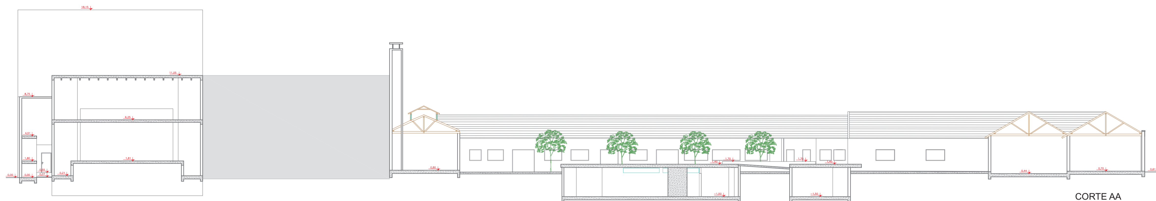
CORTE AA ESCALA 1/200

Trecho preservado com base em referências de época: registros gráficos e fotográficos. O aspecto final, para que sejam reconstituídos os cheios e vazios, dependerá do estado de conservação encontrado após a remoção das propagandas e das análises de prospecções a serem realizadas.