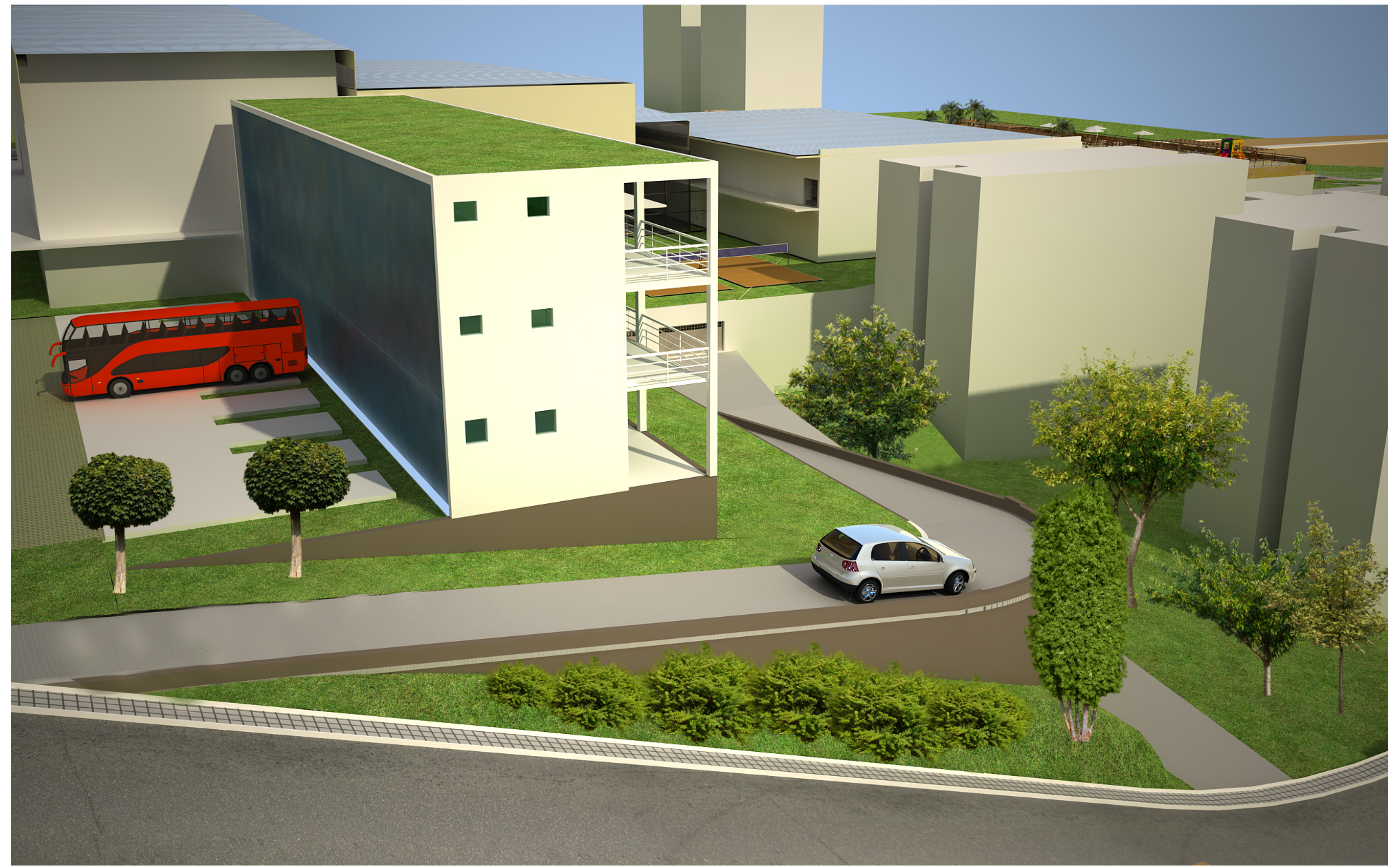
Perspectiva alojamento e acessos do estacionamento