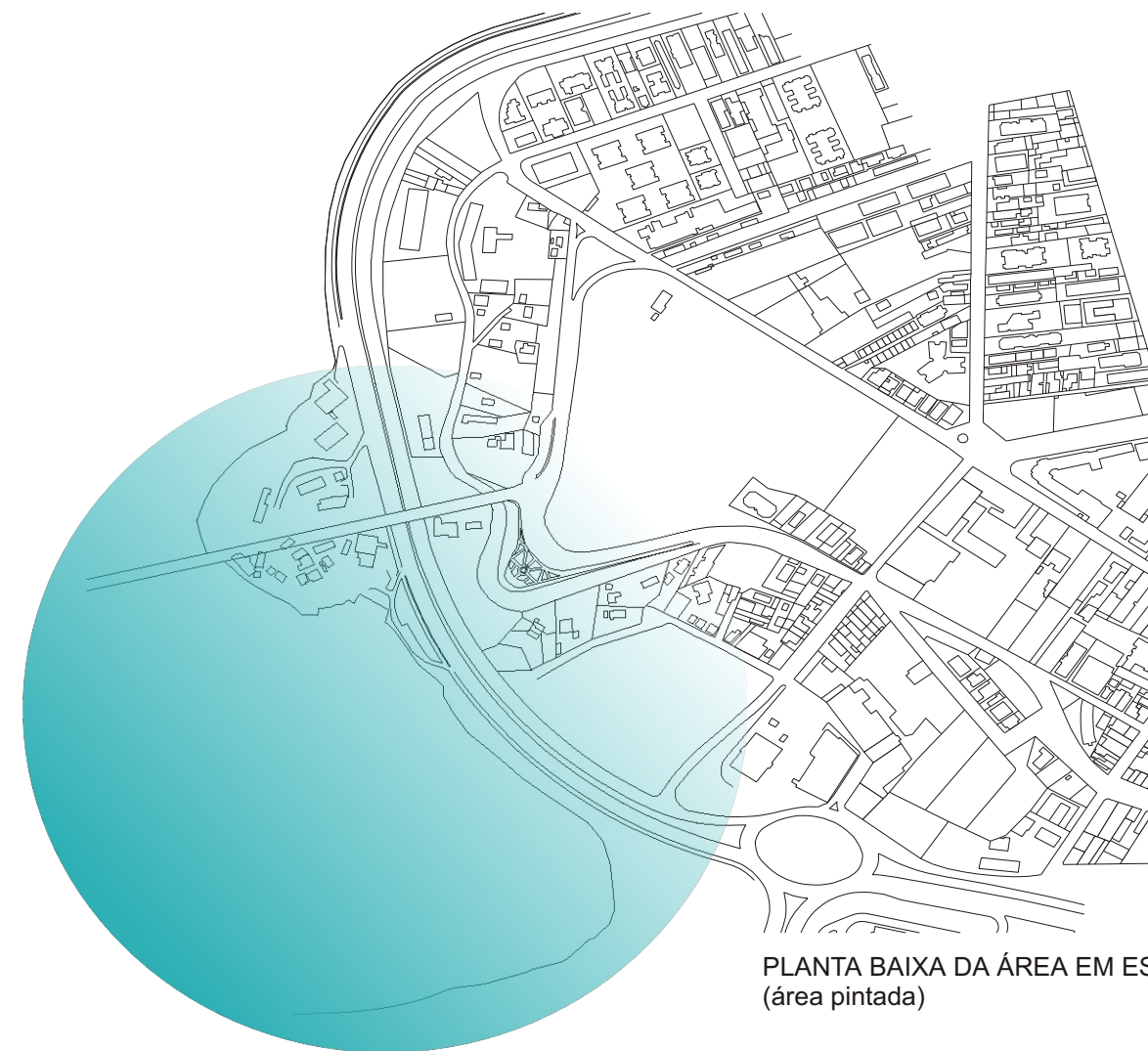
PLANTA BAIXA DA ÁREA EM ESTUDO (área pintada)