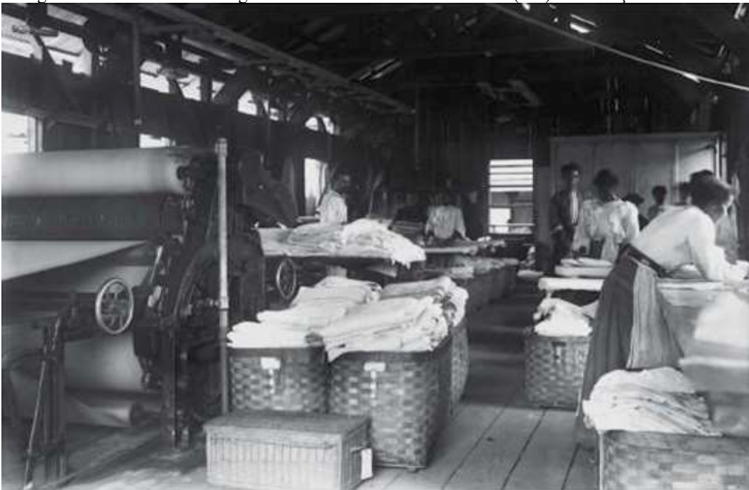
Imagem 04: Trabalhadoras imigrantes barbadianas em Porto Velho (RO) no começo do século XX