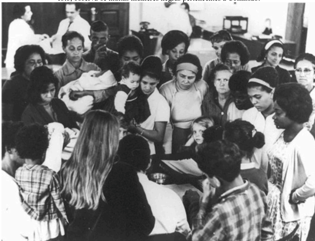
Imagem 12: Comissão de mães e esposas de presos políticos que, situadas na sede do jornal Correio da Manhã , no Rio de Janeiro, redigem um documento solicitando a Castello Branco a liberação de seus próximos. Nesta foto, observa-se muitas mulheres negras pertencentes a Comissão.