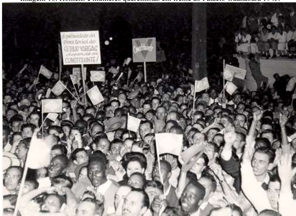
Imagem 10: Homens e mulheres queremistas em frente ao Palácio Guanabara 1945.