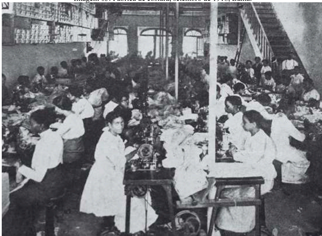
Imagem 05: Fábrica de costura, setembro de 1918, Bahia.