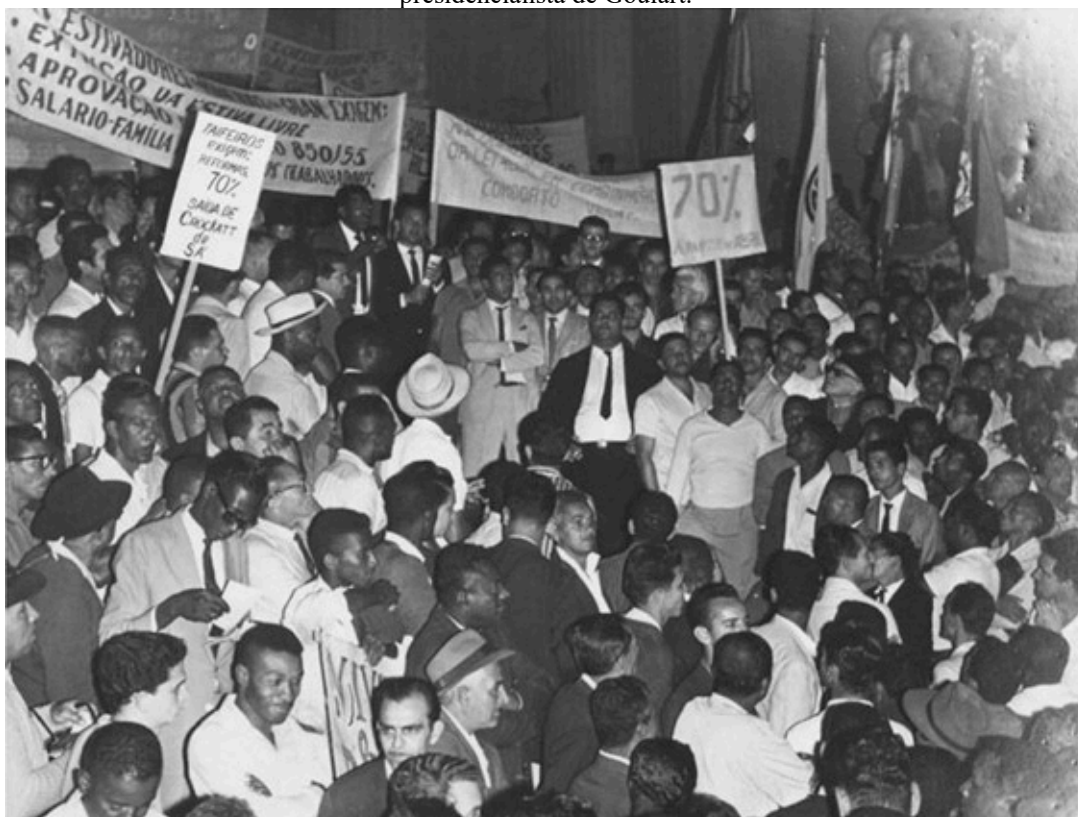
Imagem 11: A greve nacional que interrompeu os transportes no país no início do regime presidencialista de Goulart.

negociado com o FMI e, por conseguinte, foi significativamente validado pelo setor empresarial do país (FIGUEIREDO, 1993). Entretanto, esse não foi o caso das esquerdas brasileiras e, embora não seja possível identificar nenhuma mulher negra na foto a seguir, observa-se que o grupo de grevistas mobilizados durante o governo de Goulart foi majoritariamente composto por negros.