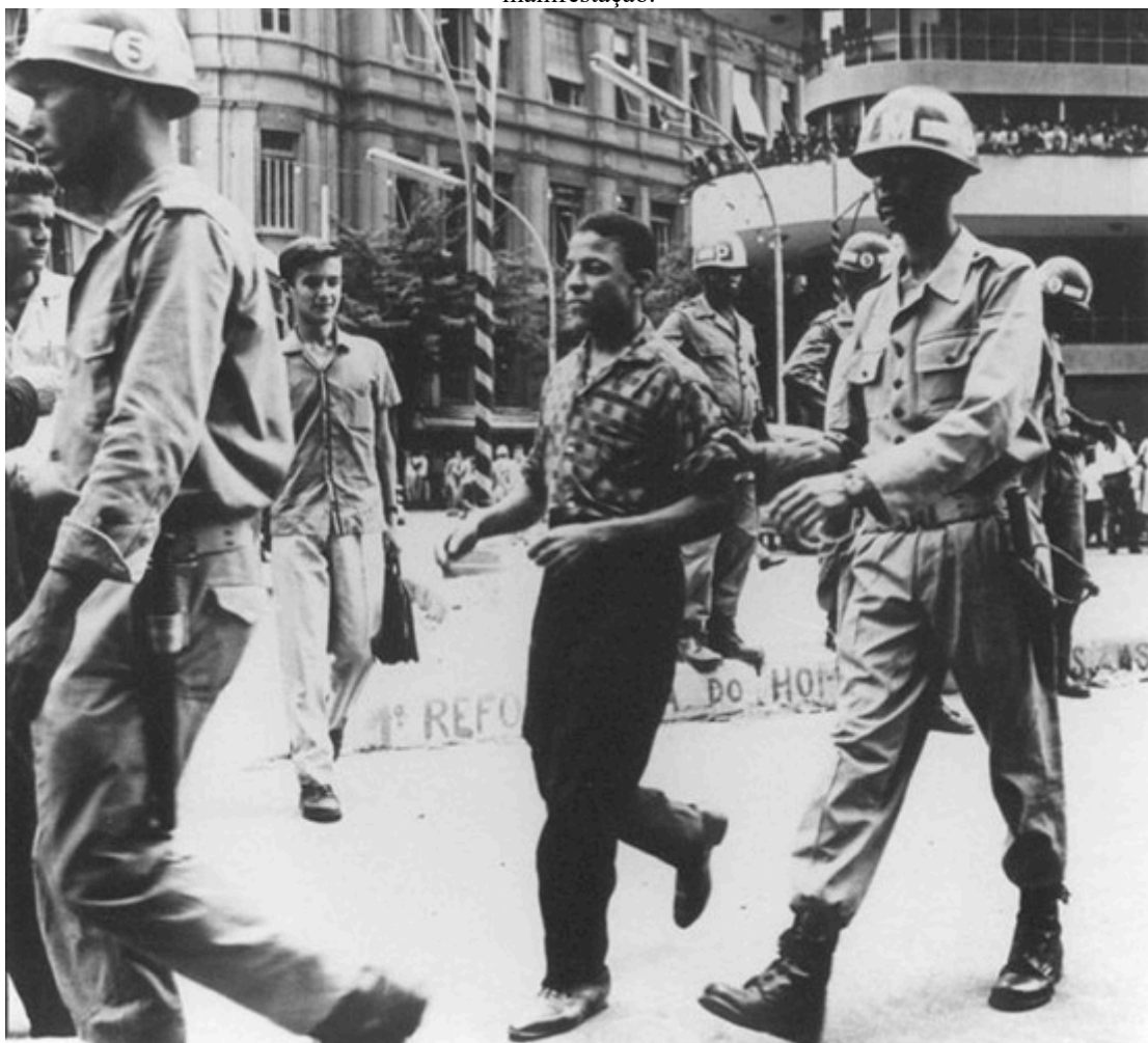
Imagem 13: Homem negro é preso pelas Forças Armadas em Belo Horizonte durante uma manifestação.