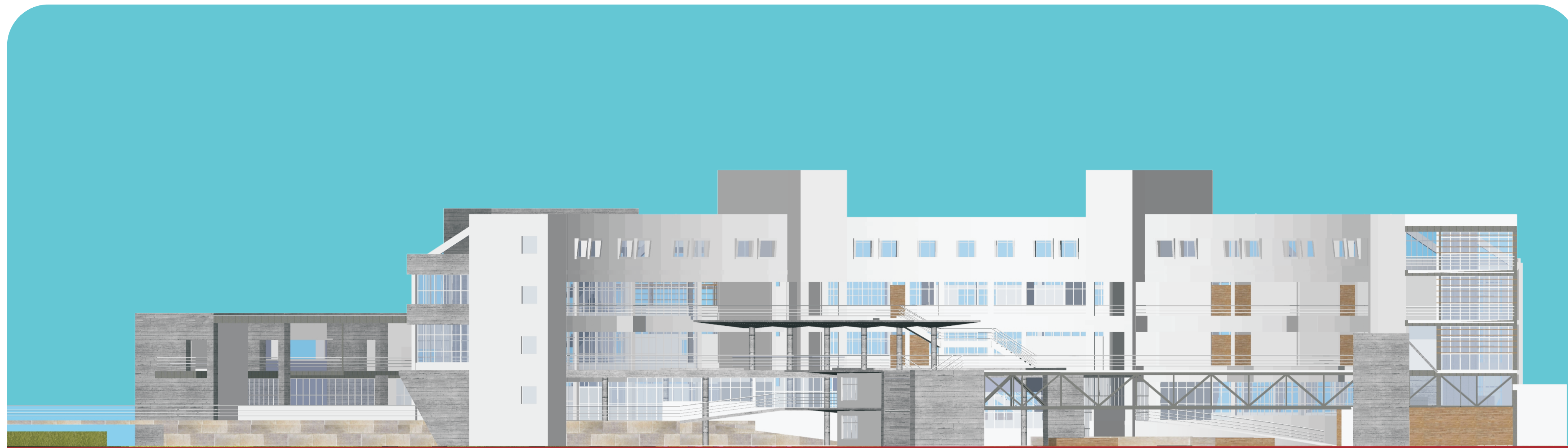
10 Fachada Norte escala 1:200