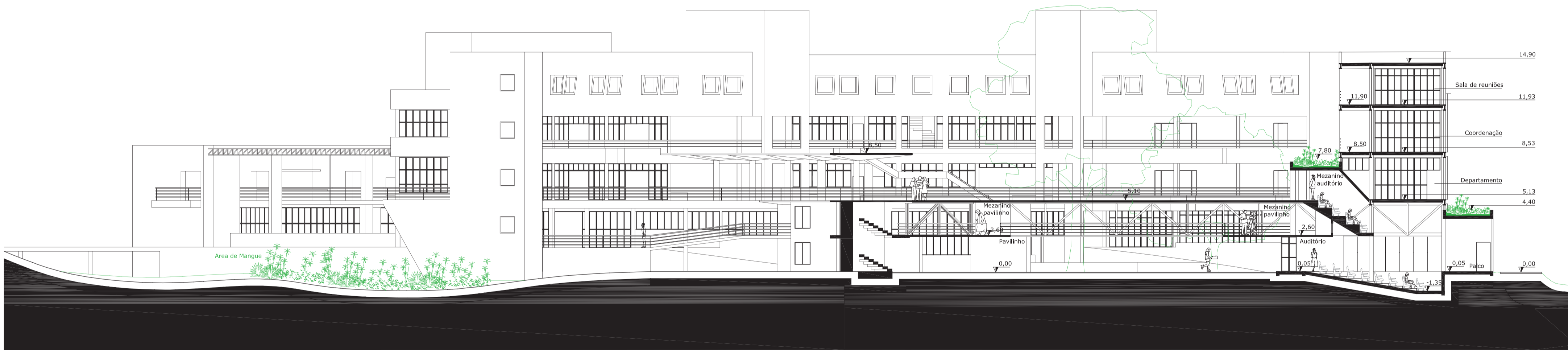
12 Corte A escala 1:200