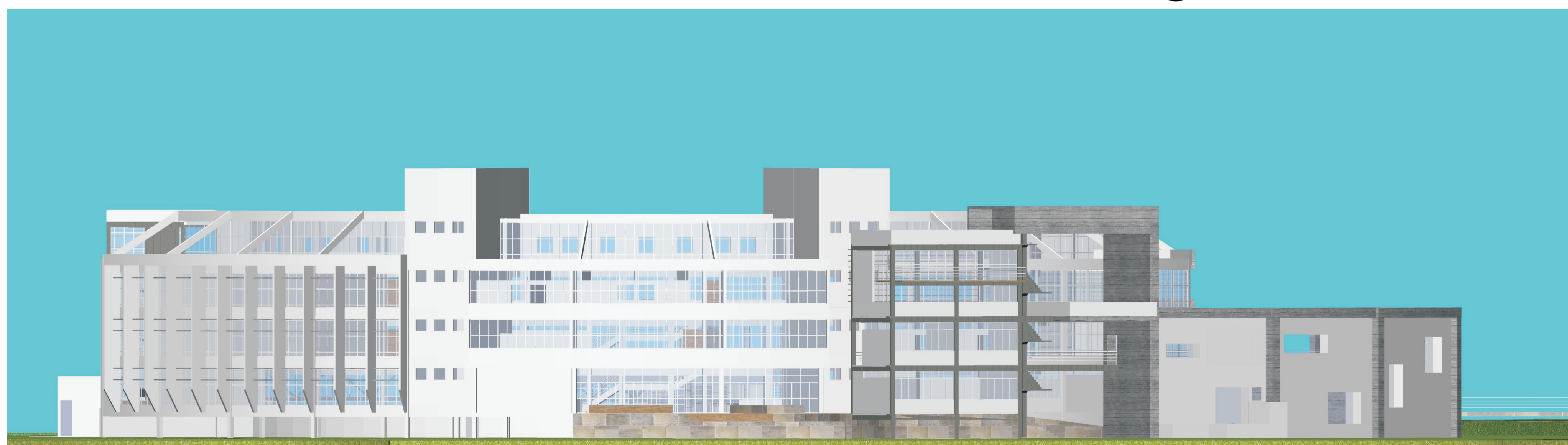
14 Fachada Sul escala 1:200

TRABALHO DE CONCLUSÃO DO CURSO – 2012.01 FAUSTO MOURA BREDÁ