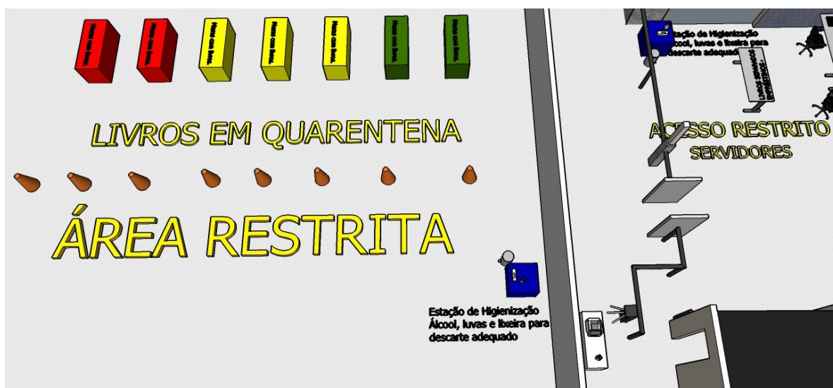
Figura 3 - Maquete gráfica do espaço do periódicos preparado para área de quarentena dos materiais