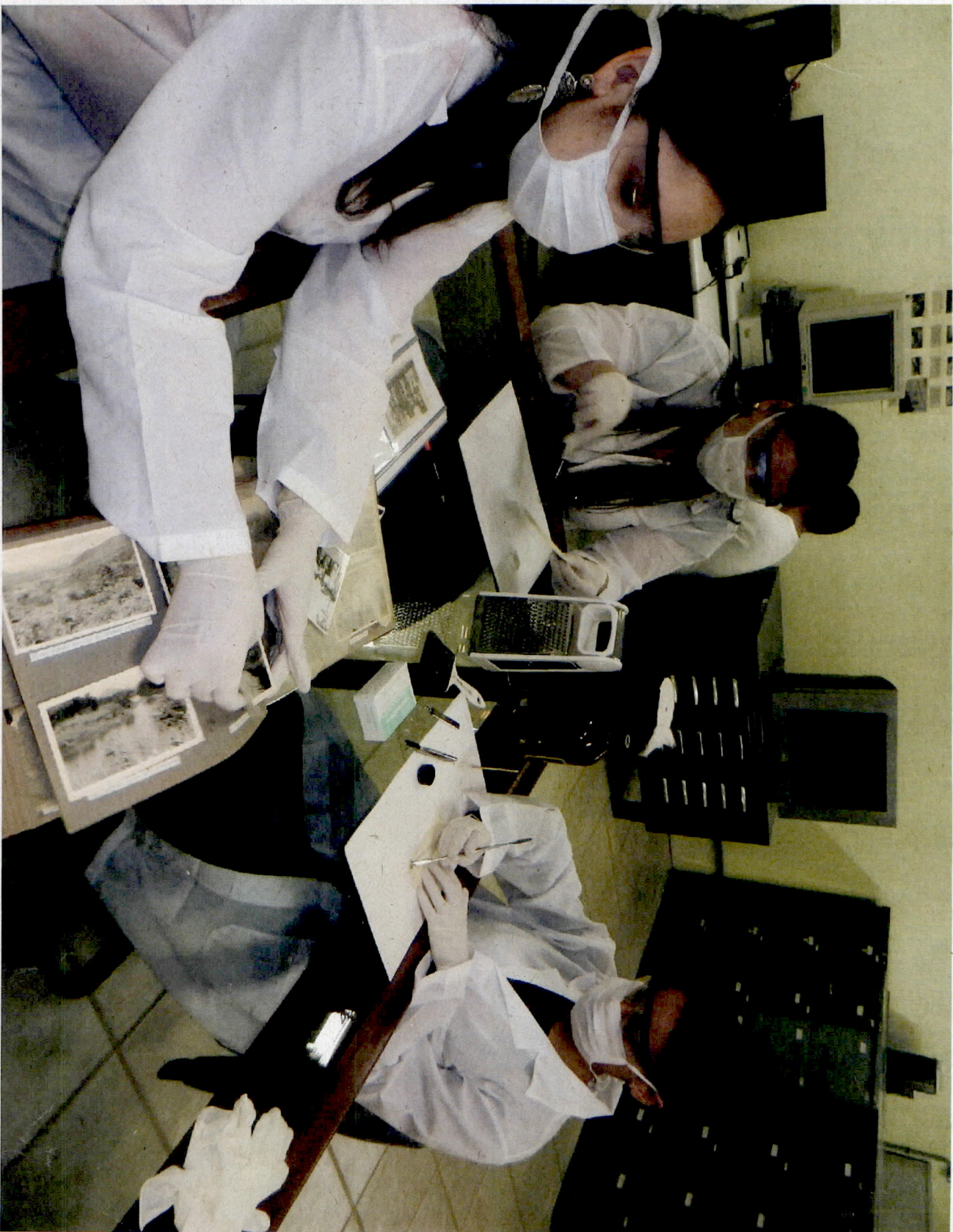
PROCESSO DE HIGIENIZAÇÃO: Escolha das fotografias, retirada da cola, limpeza com pó de borracha, limpeza com trincha, identificação das fotografias e acondicionamento.