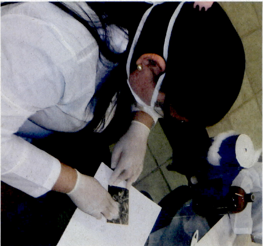
Limpeza da fotografia com algodão