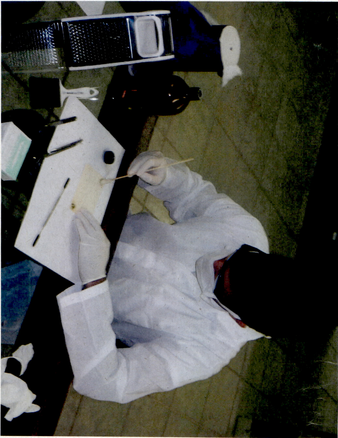
PROCESSO DE HIGIENIZAÇÃO: Uso de Benzina para remoção da cola.