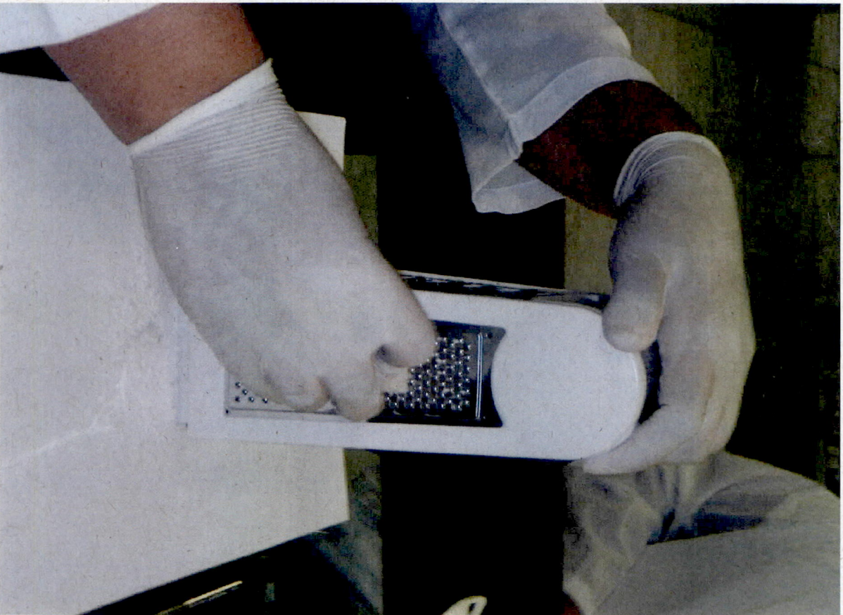
Ralador para borracha