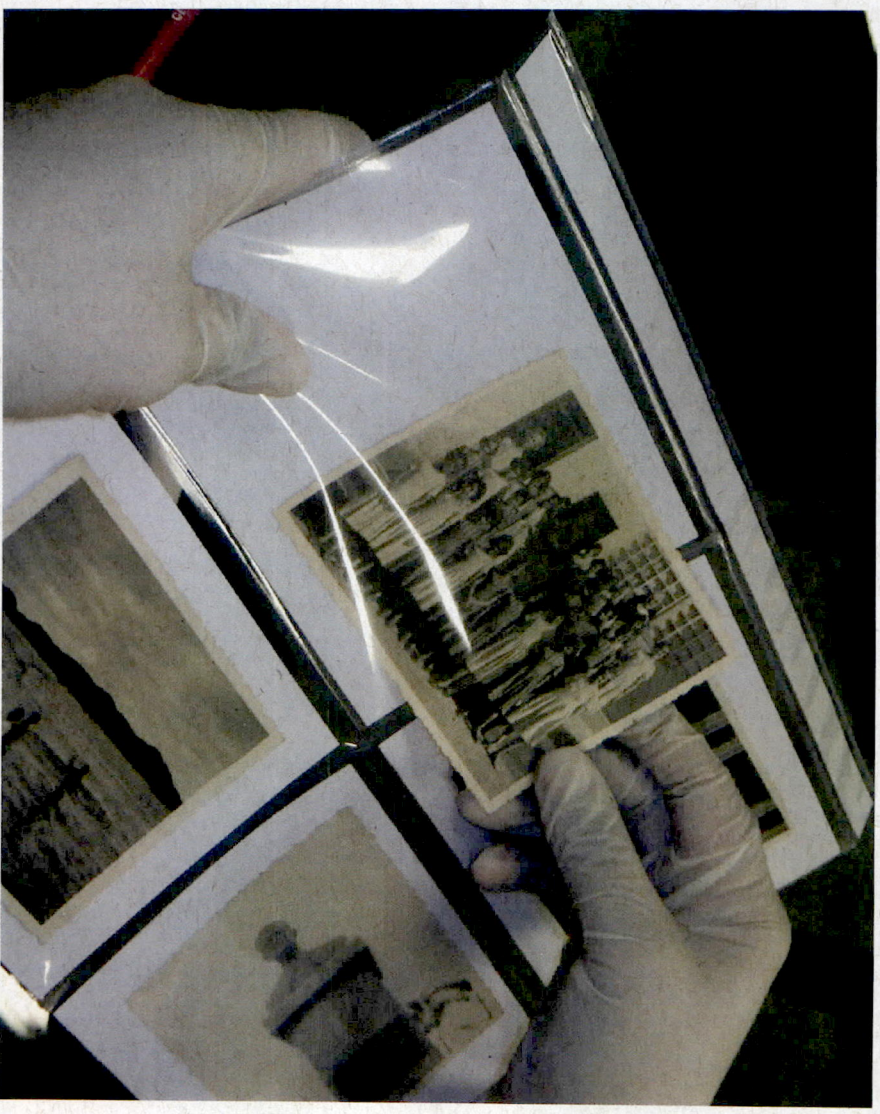
Identificação e acondicionamento das fotografias