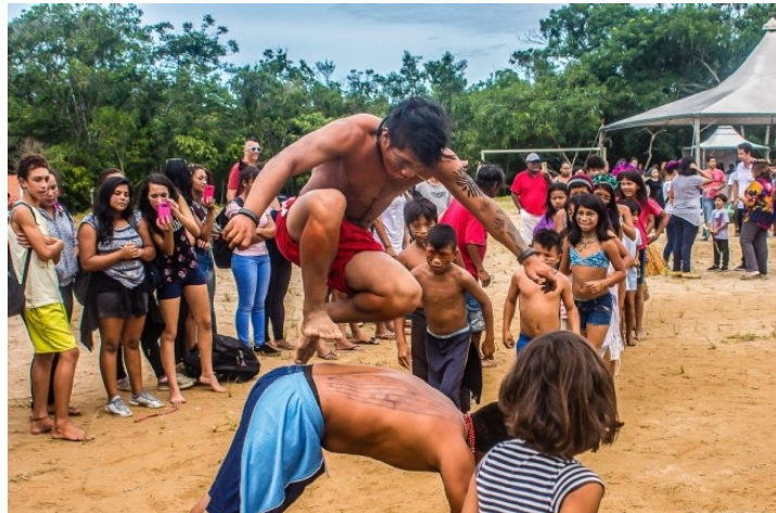
Figura 7: xondaro corpo a corpo