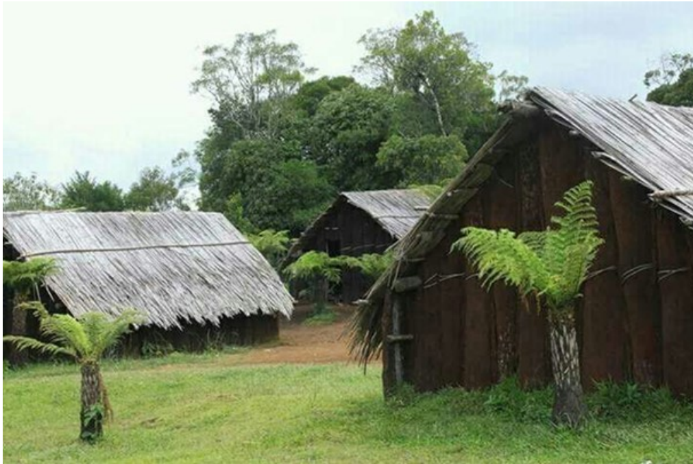
Figura 13: Aldeia campo molhado - RS