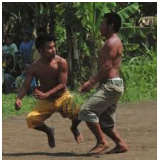
Figura 10: Prática do movimento dos animais na aldeia Tenonde Porã, SP