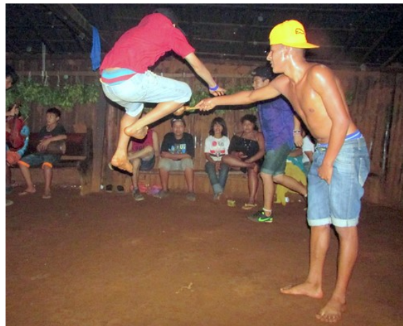
Figura 8: xondaro com a vara