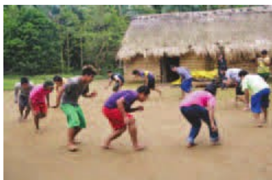
Figura 11: Xondaro em movimento