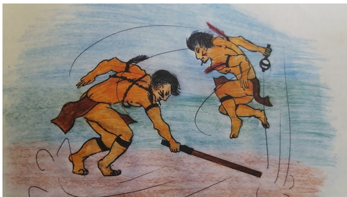
Figura 9: Desenho sobre o Xondaro

também aparecem no desenho, são os instrumentos de treinamento – o que nos permite dizer que o desenho representa o treinamento e não um conflito, uma guerra.