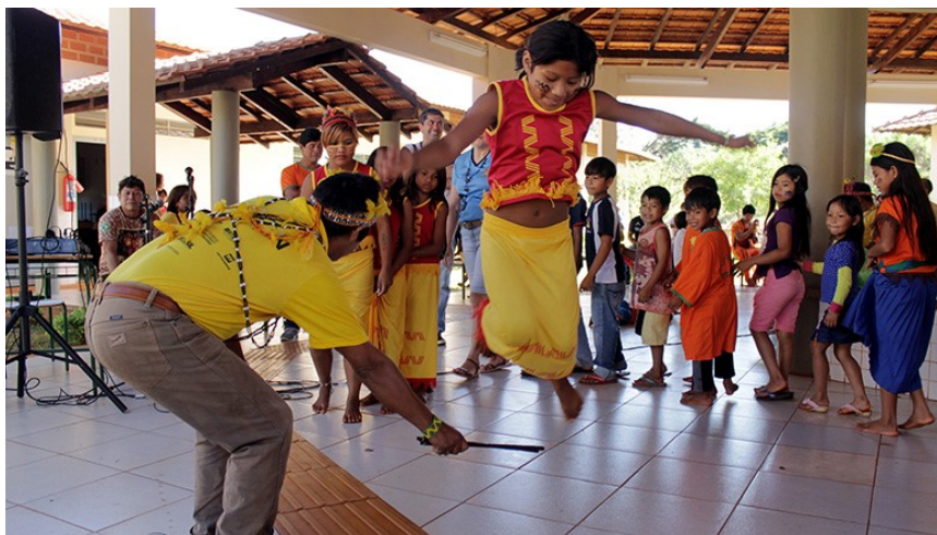
Figura 6: Crianças praticando Xondaro na aldeia Itamarã, PR