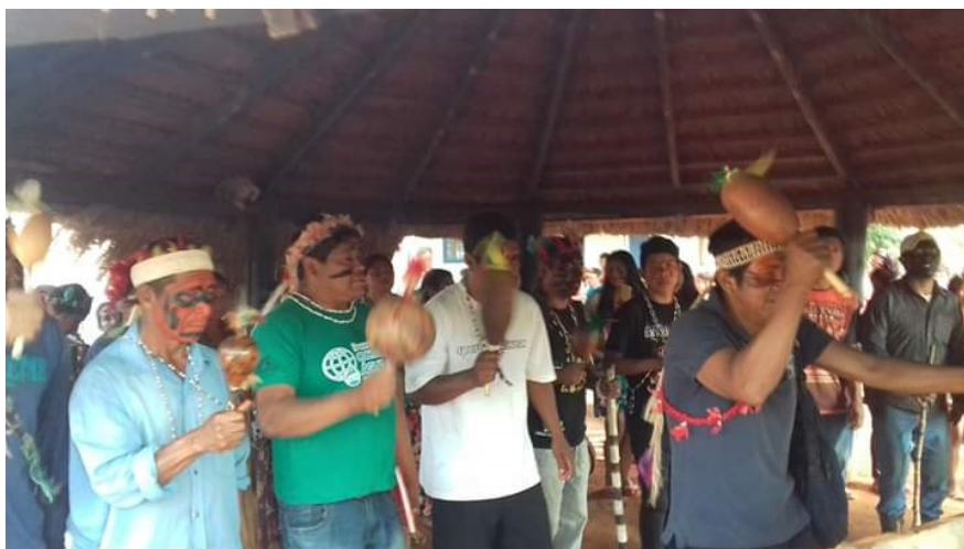
Figura 17: Líderes espirituais, aldeia Marangatu Guairá PR