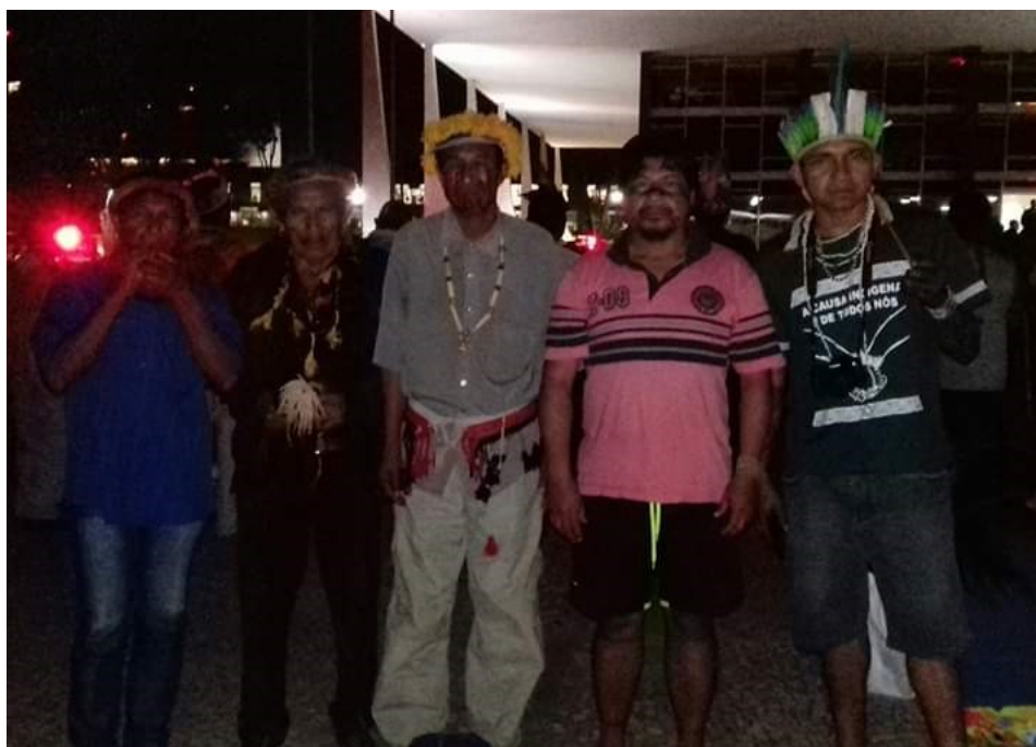
Figura 18: Brasília – STF. Xeramoin e lideranças Guarani do Mato Grosso do Sul e da Amazônia

Conforme já falamos, existem poucos trabalhos sobre o tema. Essa pesquisa não tem o intuito de se aprofundar demais, seria apenas uma primeira etapa. Tem alguns detalhes e conhecimentos que não estão escritos nesse trabalho, pois, só os Guarani podem compreender esses significados, e também porque fazem parte de nossa estratégia de resistência cultural. O Xondaro também é muito praticado na casa de reza e no pátio, sempre buscando a formação através de concentração e conexão com o espírito. A relação do xondaro está relacionada com a terminalidade do conhecimento ambiental, que fez parte da minha habilitação na Licenciatura Intercultural Indígena do Sul da Mata Atlântica. A importância do Xondaro para fortalecer a vida Guarani é uma forma de integrar a vida social, espiritual e física, além de ajudar a definir a identidade das pessoas e como se comportar com os outros. Conhecer a história e os valores da cultura Guarani é tão importante, quanto a fala. Assim o xondaro abrange também gastronomia, terapia, defesa pessoal, treinamento de resistência, nobreza, saúde e as histórias. O Xondaro é nossa dança, nossa prática, conhecimento, religiosidade e também nossa resistência!