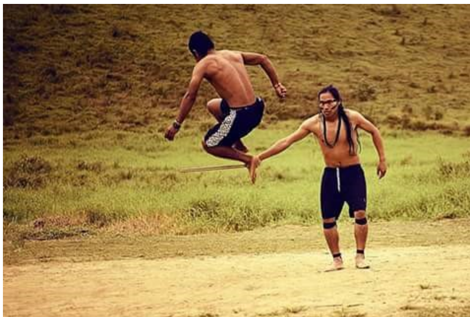
Figura 5: Xondaro na Aldeia Taquari- São Paulo

intensidade dos movimentos; Na terceira etapa são incluídos os obstáculos, exemplo, as varas e depois com o arco e flecha.