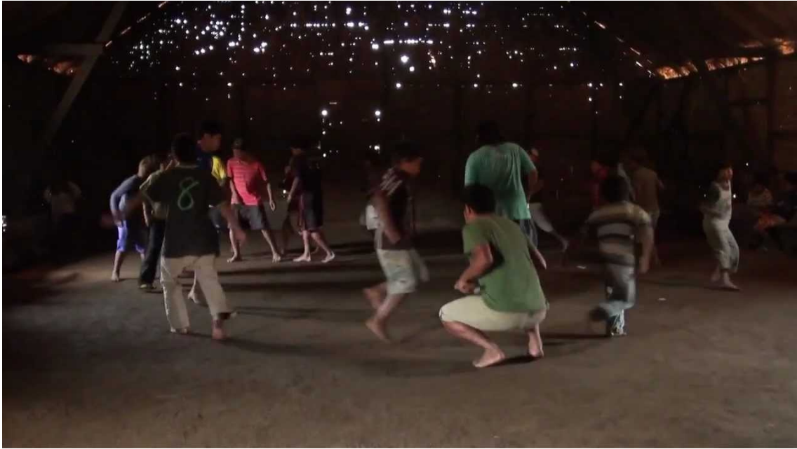
Figura 14: Xondaro aldeia Tenonde Porã SP