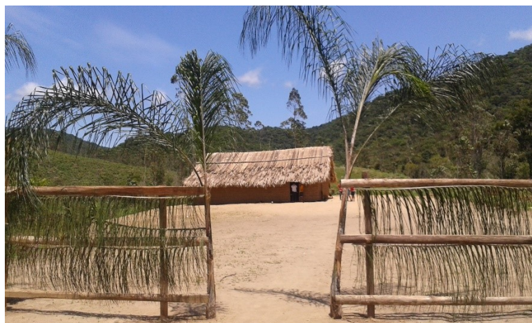
Figura 16: Opy, a casa de reza (Aldeia Marangatu- Imaruí-SC)

Para exemplificar essa relação, podemos dizer que o Xondaro pode ser também chamado de Tangará, que é um pássaro. Antes de ser pássaro, Tangará foi um grande pajé, com treinamento também para um grande Xondaro. Devido um acontecimento que ele não suportou, ele usou a técnica do Xondaro, quando não poderia fazer isso. Com isso ele foi transformado em pássaro. Isso porque Deus, na época, não queria que a história dele se acabasse, mas não podia deixá-lo como ser humano. Alguma coisa deveria ser feita. Deus escolheu então deixá-lo como Tangará para que assim vivesse para sempre.