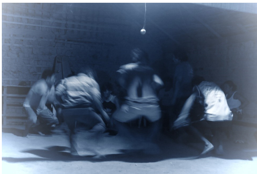
Figura 2: A arte do Xondaro no Pará

Na aldeia Tekoa Pyau, que fica no município Jacundá, no estado do Pará, em uma distância de cem quilômetros de Marabá, já não se praticava mais o Xondaro. Como contrapartida durante a realização do projeto de etnomapeamento pelo CTI a comunidade solicitou a vinda de um guarani para ensinar o Xondaro nessa aldeia. Dessa forma, fui convidado para ensinar e mostrar os movimentos do Xondaro nos anos de 2017, 2018 e 2019 (Fig.2). Fiquei três semanas em cada ano lá. Mulheres e homens participaram e demonstraram muito interesse. Ao trazer essas práticas novamente a essa aldeia, as memórias foram retornando e hoje em dia eles próprios fazem essa prática sem ajuda externa. A imagem a seguir foi tirada durante essa experiência.