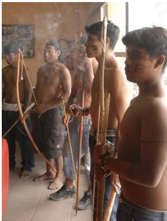
Figura 19: Lideranças do Xondaro nos dias de hoje