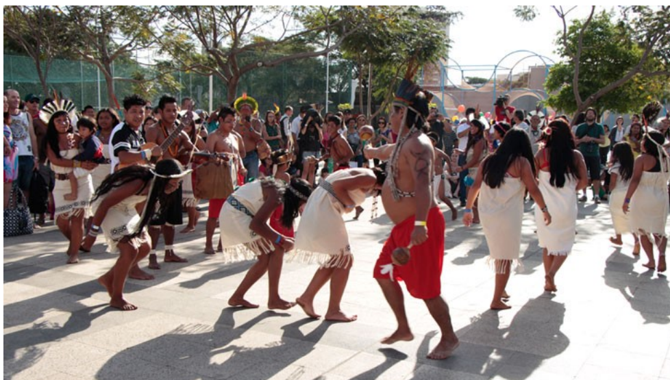
Figura 12: Xondaria praticando xondaro - SESC - SP

Todo mundo, homens e mulheres, passa/aprende, pratica o Xondaro - criança e jovem (ensino fundamental e médio); depois disso escolhe a formação – casa de reza ou mestre Xondaro.