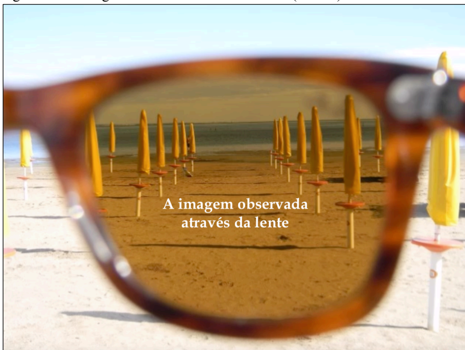
Figura 2 – A imagem observada através da lente (tela 33)

Nota: Legenda: A imagem observada através da lente. Música: Rainbow After Rain, de Pavel Yudin.