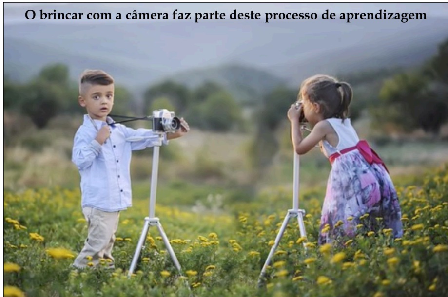
Figura 5 – O brincar com a câmera faz parte deste processo de aprendizagem (tela 86)

Nota: Legenda: O brincar com a câmera faz parte deste processo de aprendizagem. Música: A Wonderful Day, de Gyom.