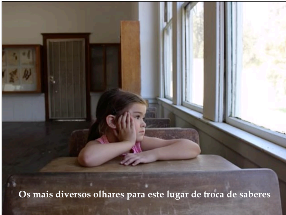
Figura 3 – Os mais diversos olhares para este lugar de troca de saberes (tela 58)

Nota: Legenda: Os mais diversos olhares para este lugar de troca de saberes. Música: Happy Kid, de Arthur Basov.