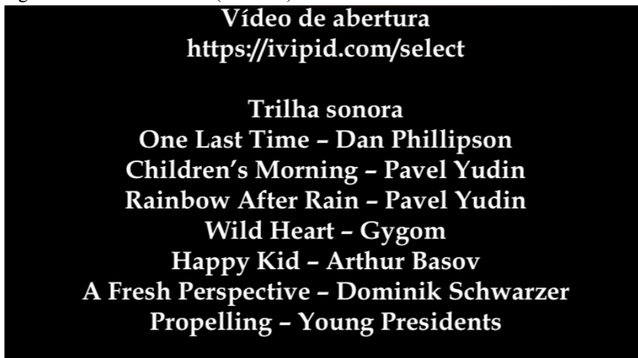
Figura 6 – Créditos finais (tela 106)

Nota: Legenda: Vídeo de abertura: https://ivipid.com/select/ Trilha sonora: One Last Time – Dan Phillipson/Children’s Morning – Pavel Yudin/Rainbow After Rain – Pavel Yudin/Wild Heart – Gyom/Happy Kid – Arthur Basov/A Fresh Perspective – Dominik Schwarzer/Propelling – Young Presidents Música: The Old Cinema, de Crescent Music.