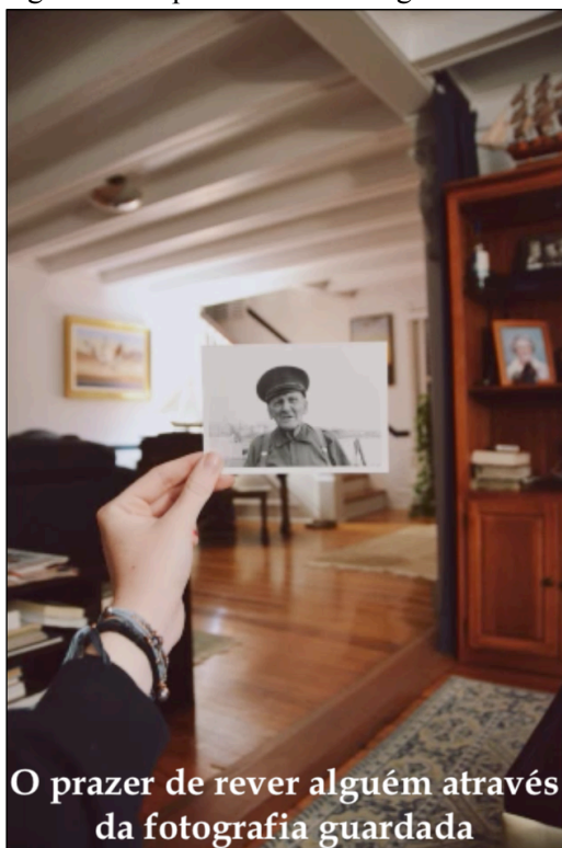
Figura 4 – O prazer de rever alguém através da fotografia guardada (tela 76)

Nota: Legenda: O prazer de rever alguém através da fotografia guardada. Música: Propelling, de Young Presidents.