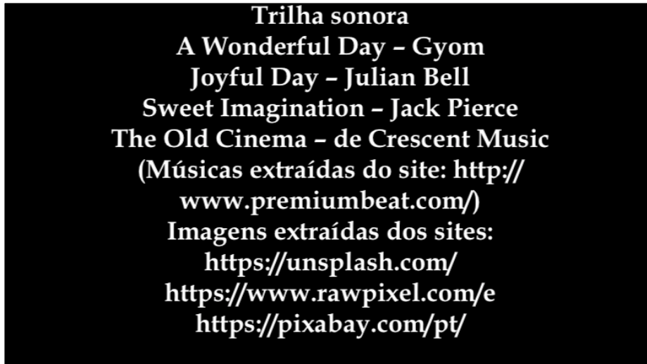
Figura 7 – Créditos finais (tela 107)

Legenda: Trilha sonora: A Wonderful Day – Gyom/ Joyful Day – Julian Bell/Sweet Imagination – Jack Pierce/The Old Cinema – Crescent Music (Músicas extraídas do site: http://www.premiumbeat.com/ ) Imagens extraídas dos sites: https://unsplash.com/ , https://www.rawpixel.com/e e https://pixabay.com/pt/ Música: The Old Cinema, de Crescent Music.