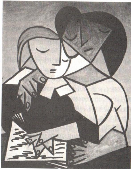
Imagem 3 – Pablo Picasso. Two girls reading , 1934, óleo sobre tela, 92,2 x 73 cm. Museu de Arte da Universidade de Michigan. Estados Unidos

Aproximando-nos do cubismo e à luz de algumas fissuras que este movimento artístico nos provoca na tangência da teorização da visualidade (Flores, 2013), escolhemos a obra “ Two Girls Reading ” (1934) de Pablo Picasso para desencadear pensamentos a partir do ‘acontecer’ do nosso exercício de olhá-la e experimentá-la.