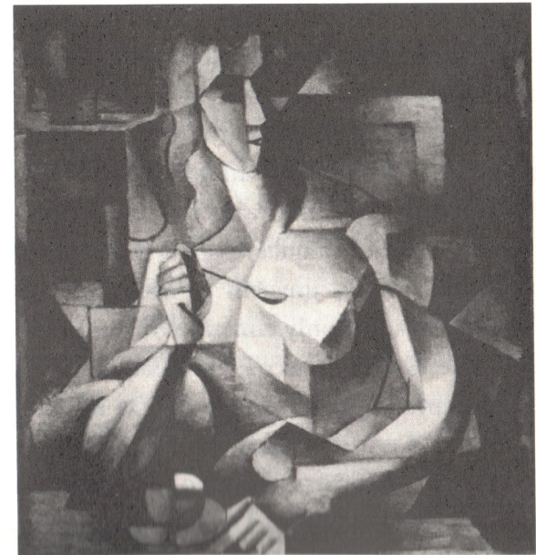
Imagem 2 – Jean Metzinger. Hora do chá , 1911, óleo sobre cartão, 75,9 x 70,2 cm. Museu de Arte da Filadélfia, Filadélfia.