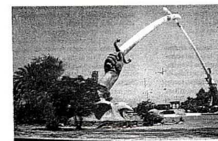
PORTAL Local onde passavam as tropas do exército de Saddam Hussein durante os desfiles cívicos em Bagdá

Como foi a escolha pela profissão? Resolvi seguir a carreira de diplomata a partir da leitura de um livro que narrava a trajetória de Benjamin Disraeli. Ele, por meio da diplomacia, teve grandes êxitos para o seu país. Aquilo me impressionou. Pensei: Esta é uma maneira positiva de dar uma contribuição à sociedade". Entrei no Instituto Rio Branco com idade mínima, aos 20 anos. Fiz serviço militar, servi à Marinha porque gosto do mar – por isso estou morando em Florianópolis. O mar sempre esteve perto da minha vida.