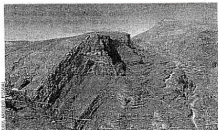
CENÁRIO Montanhas do Curdistão, localizadas no norte do Iraque