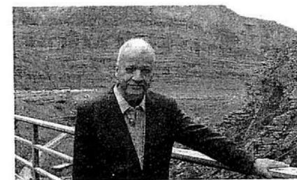
VIAGEM O embaixador em visita às montanhas do Curdistão