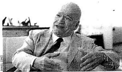
O EMBAIXADOR Bernardo de Azevedo Brito em sua casa, em Florianópolis: "A economia do Iraque está em plena expansão"