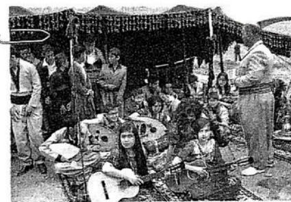
CULTURA Apresentação de músicos infantis em Erbil, no Curdistão