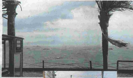
Além dos sustos e prejuízos, ventania provocou falta de luz em mais de 30 mil unidades da Grande Florianópolis