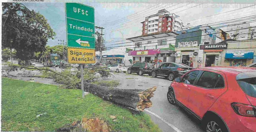
Árvore foi arrancada com a força do vento na rua Deputado Antônio Edu Vieira, no bairro Pantanal