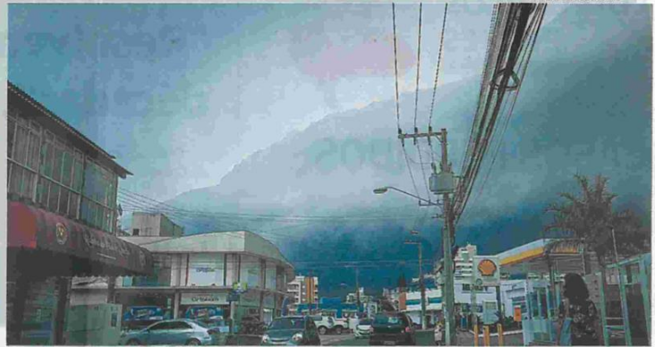
Instabilidade que atingiu Santa Catarina ontem volta hoje e pode provocar mais ventos fortes

Às 16h50 foi informado que os objetos já haviam sido retirados da pista e o local estava liberado. Entretanto, o trânsito apresentou lentidão devido a diversas ocorrências ocasionadas pelo mau tempo e ventania.