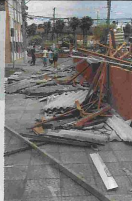
Apartamentos, casas, creches e comércios foram atingidos pelos fortes ventos