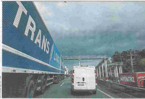
Com a queda de placas sobre as estradas, trânsito ficou lento