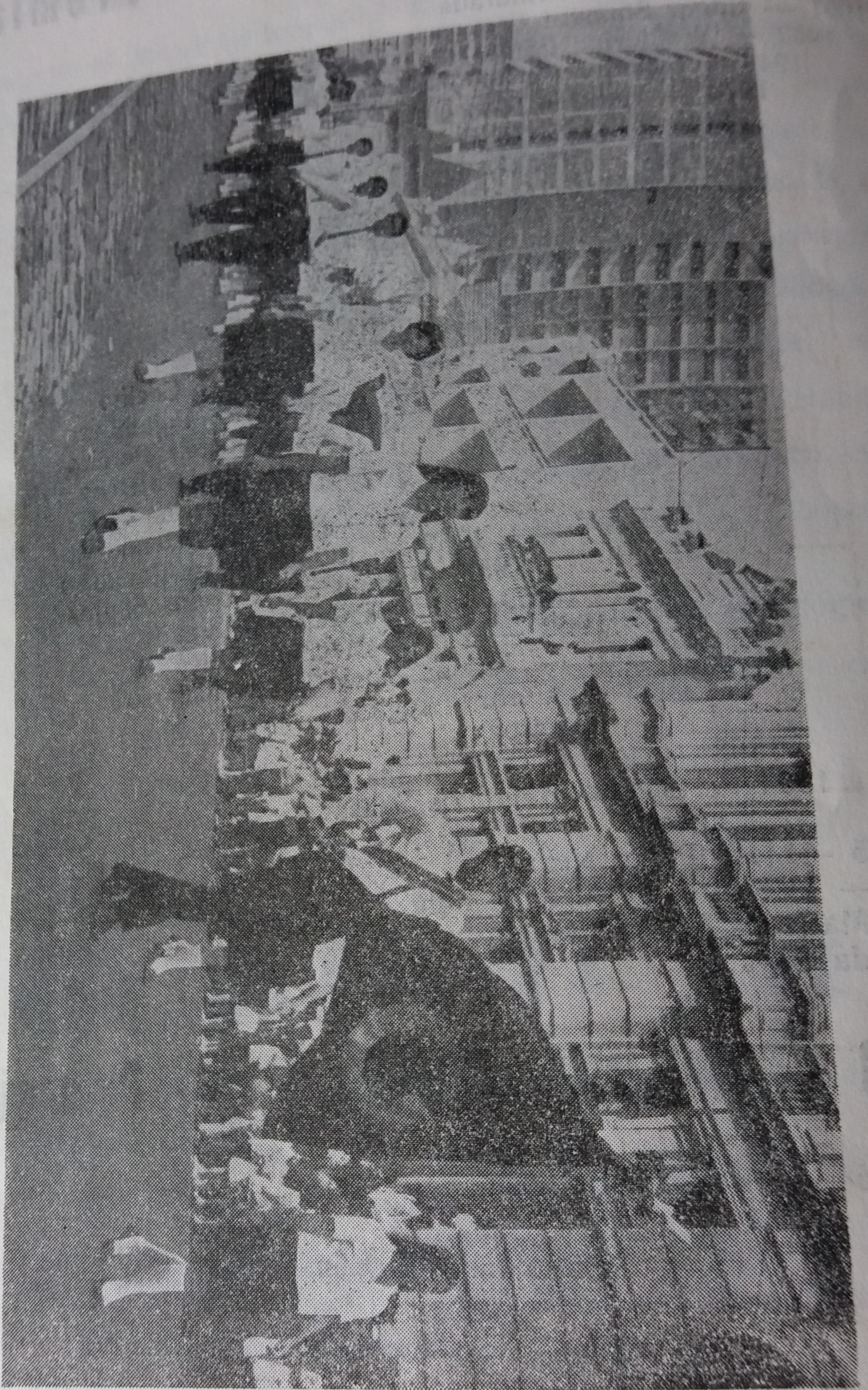
Desfile da Semana Granberyense de 1967