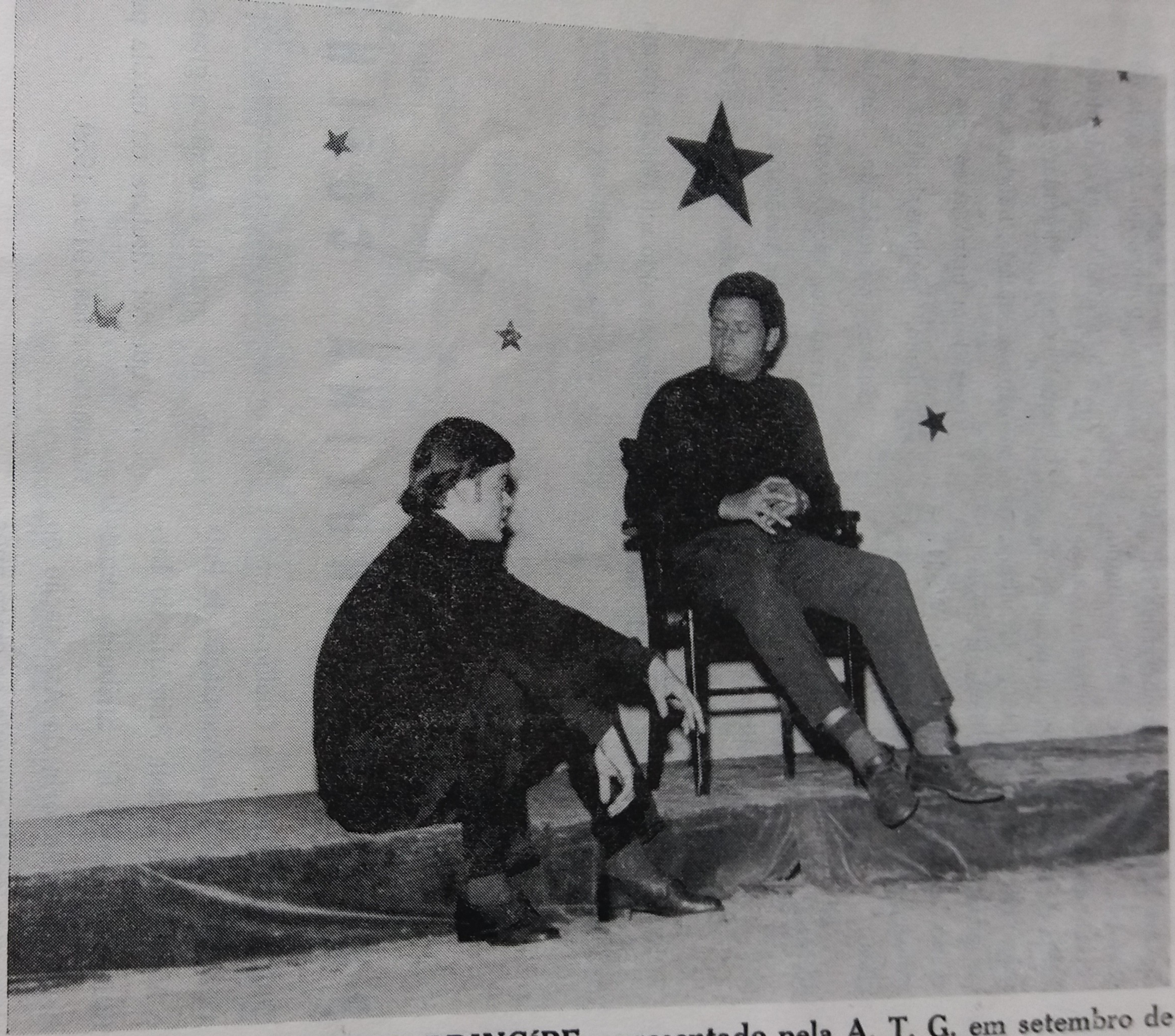
Uma das cenas do PEQUENO PRINCÍPE apresentado pela A. T. G. em setembro de 1968