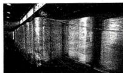
Material. Rolos do piso de borracha natural estão armazenados em um ginásio da UFSC

CONQUISTA Reforma da pista, que começou na semana passada, é a primeira em 35 anos