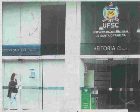
UFSC teve quatro cursos com nota máxima

Segundo ela, esse mesmo motivo também pode explicar a diferença entre os resultados dos cursos de instituições públicas e particulares.