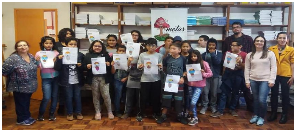
Figura 4 – Registro da ação Motus na Escola na EMEB Princesa Isabel

expostas no saguão da UNIPAMPA - Campus Alegrete entre os dias 08 e 30 de abril de 2019 no formato de um varal.