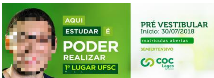
Figura 4 - Aqui estudar é poder realizar, semiextensivo COC Lages.

Poucos meses depois, o estudante protagonizou as campanhas de matrículas do curso semiextensivo da marca COC, com a legenda “Aqui estudar é poder realizar”: