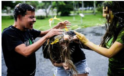
Figura 3 - Candidatos comemoram aprovação em Medicina.

no destaque de frases como “vestia um jaleco escrito "Bixo Med" e comemorava com champanhe na manhã desta terça.” (WENZEL, 2018).