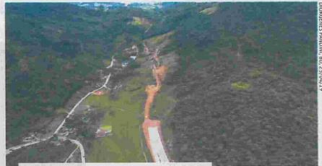
Projeção de conclusão em 2022 é mantida

O trecho Norte e o intermediário do contorno têm previ-