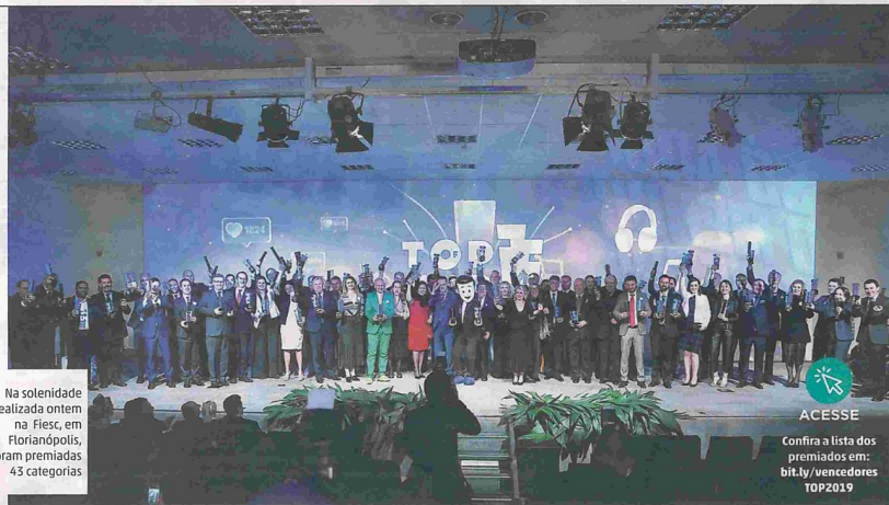
Na solenidade realizada ontem na fieste, em Florianópolis, foram premiadas 43 categorias