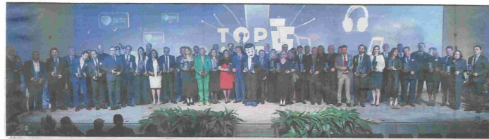
TOP OF MIND NOITE DE PREMIAÇÃO PARA AS EMPRESAS DE SANTA CATARINA Marcas mais lembradas do Estado foram reconhecidas no Prêmio Top Of Mind | PÁGINA 12 E CADERNO ESPECIAL