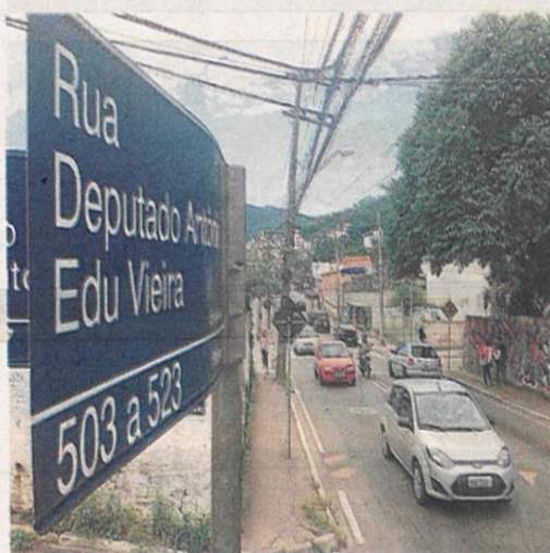
Verba para realização da obra está garantida desde dezembro de 2013

ternativa para suavizar o trânsito na região: a UFSC abrir uma estrada de acesso ao Restaurante Universitário (RU) e o Centro de Filosofia e Ciências Humanas (CFH) por meio do bosque, espaço que ficou conhecido pelo confronto entre estudantes e a