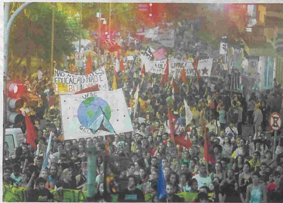
Manifestantes protestaram no Largo da Catedral, na Beira-Mar Norte e próximo ao Terminal Cidade de Florianópolis

A greve geral convocada por centrais sindicais e movimentos sociais em todo o país na sexta-feira contra a reforma da Previdência também teve reflexos em Santa Catarina. Trabalhadores do transporte público, da educação, da saúde e dos bancos aderiram à paralisação. Serviços de coleta de lixo, correios e até do comércio também pararam em alguns municípios.