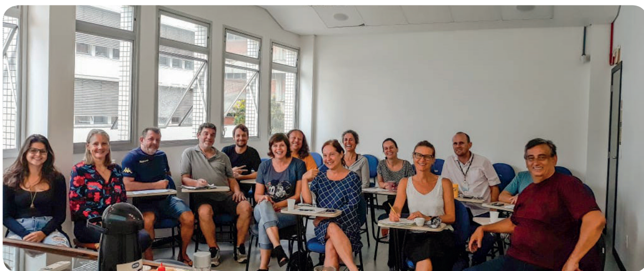
Descrição da Imagem: Equipe da Direção do CFH em reunião de Planejamento no Bloco E/Anexo. Eles/as estão sentados/as, formando uma meia-lua. Olham e sorriem para a câmera.

A UFSC tem uma página dedicada ao assunto: http://planejamento.paginas.ufsc.br , onde disponibiliza conteúdos para ajudar os setores a conduzirem o planejamento e construam seus planos. O objetivo é que as práticas de Planejamento e Gestão Estratégica sejam efetivamente institucionalizadas na Universidade.