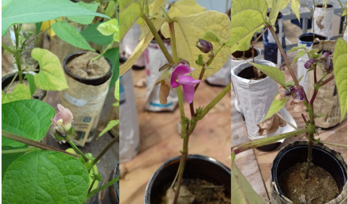
Figura 3. Florescimento pleno dos genótipos locais e comerciais de feijão comum.

nódulos viáveis (%), obtidos pela divisão do número de nódulos viáveis por número de nódulos total; (e) massa seca de raiz, (mg) e (f) relação raiz parte aérea, obtida pela divisão da massa seca da raiz, pela massa seca da parte aérea, resultado obtido em mg de raiz/ mg de parte aérea.