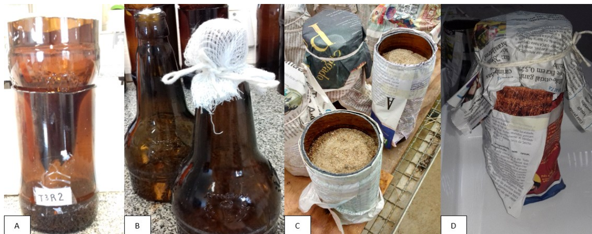
Figura 1. (A) Vaso de Leonard adaptado. (B) A extremidade da garrafa protegida com algodão e gaze. (C) Sistema montado e envolto por jornal. (D) Vaso pronto para ser autoclavado.

Foram utilizados vasos de do tipo Leonard adaptados (SANTOS, 2009) apresentados na Figura 1A, que foram previamente desinfetados em solução de hipoclorito de sódio na concentração de 5%, por cinco minutos e em seguida lavados em água corrente. Na extremidade mais fina da garrafa foi colocado algodão e uma gaze (Figura 1B) para barragem do substrato, e todo o sistema foi envolto por jornal (Figura 1C). Só então o substrato era então acondicionado no vaso e posteriormente tampado com uma folha de jornal (Figura 1D). Na base da garrafa foi colocado 100 mL de água e o sistema era levado para a autoclave vertical, modelo Linha CS (Prismatec), para o processo de esterilização como um todo, com duração de 20 minutos à 1 atm de pressão.