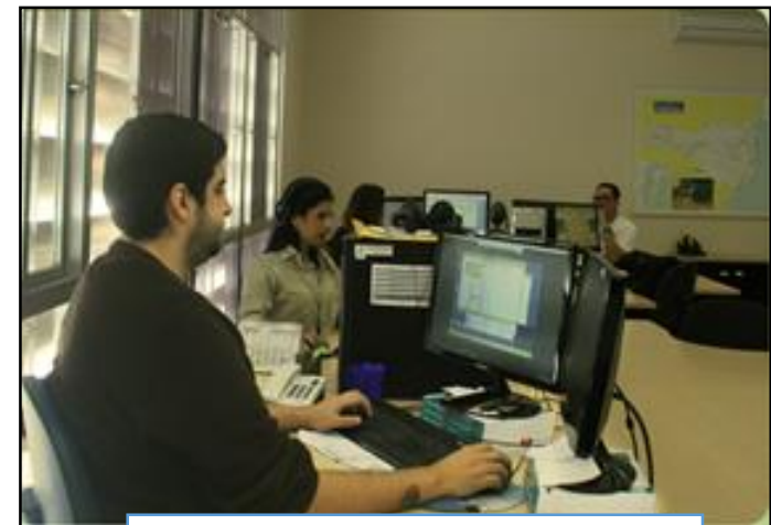
Help Desk e-SUS AB