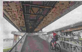
Ferrugem tomou conta das duas pontes