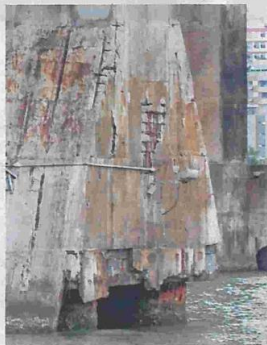
Ferros expostos com a corrosão do cimento