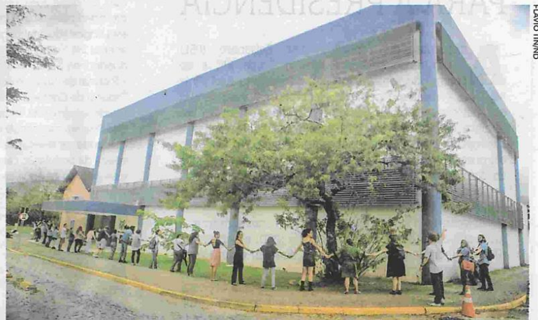
Alunos dos cursos de museologia e antropologia deram um abraço simbólico no prédio do museu

Uma das ações tomadas de imediato, segundo a diretora, foi o agendamento de uma vistoria do Corpo de Bombeiros no pavilhão de exposições do museu, o que deve acontecer ainda nesta semana. O objetivo é avaliar condições de segurança e de adequações no sistema de combate a incêndio. ●