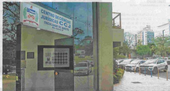
Denúncia de fraude ocorreu no curso de direito

As informações levantadas pela Saad foram levadas ao conhecimento do Conselho Universitário, que, por sua vez, entendeu que havia “fortes indícios de fraudes” e solicitou apuração administrativa. Conforme manda o protocolo interno, a AGU (Advocacia-Geral da União) também foi comunicada, mas só se manifestou favorável à verificação das autodeclarações no segundo semestre do ano passado. Os casos, que seriam mais de 20, ainda não foram julgados. ■