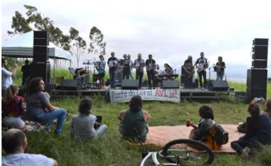
FIGURA 6 - Evento cultural realizado na Ponta do Coral