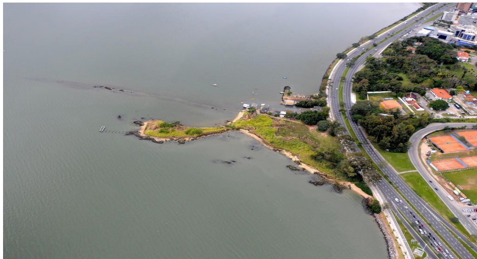
FIGURA 5 – Ponta do Coral

A Ponta do Coral é considerada uma área verde, porém, vem sofrendo com as tentativas de edificações e ameaças de privatizações. Dessa forma, os movimentos sociais vem lutando e organizando ações para impedir o fechamento da área e garantindo o espaço para a comunidade. O espaço é utilizado principalmente nos fins de semana, são realizados eventos culturais gratuitos, práticas de futebol, dança e entre outros.