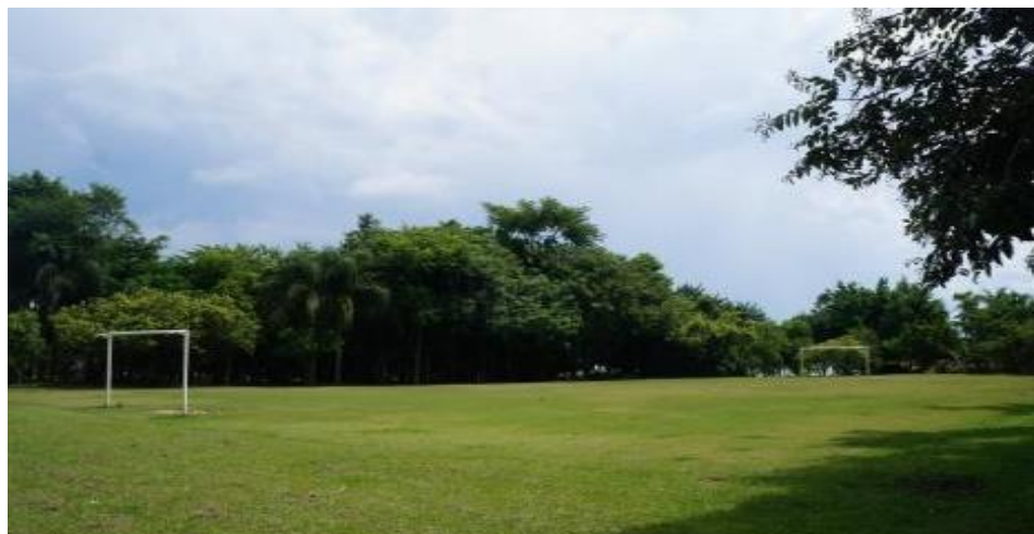
Figura 3 – Campo de futebol do Parque da Luz