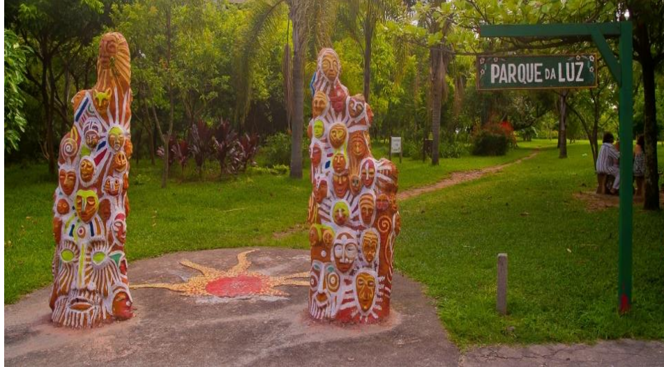
FIGURA 4 – Parque da Luz