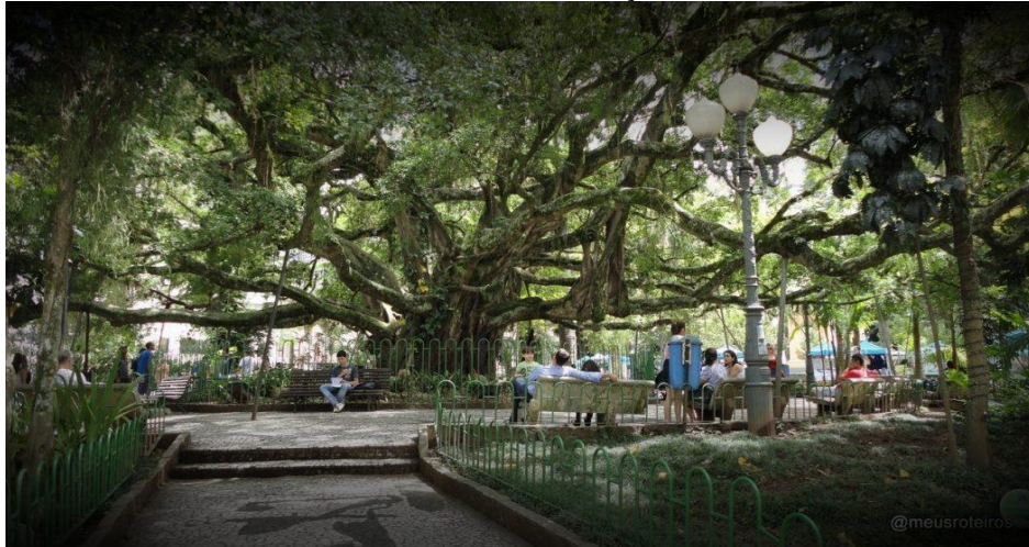
FIGURA 2 – Praça XV de novembro

[...] Quando nos referimos ao termo, estamos considerando um conjunto de instalações associadas, destinadas às práticas e aos serviços de lazer, espacialmente distribuídas conforme um projeto arquitetônico em um determinado ambiente ou espaço social e geográfico escolhido dentro de um território (PINA, 2017, p.57).