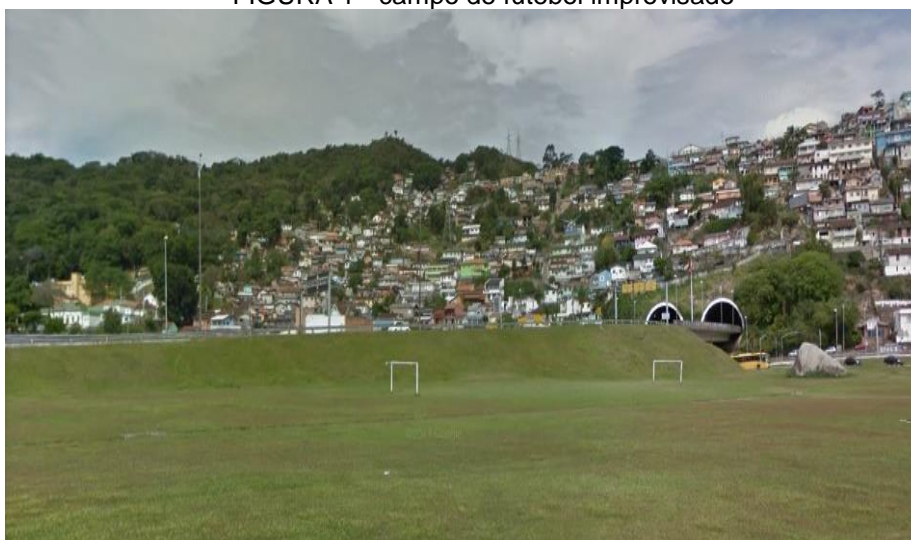
FIGURA 1 - campo de futebol improvisado