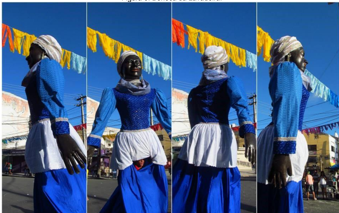
Figura 3: Boneca da Lavadeira.