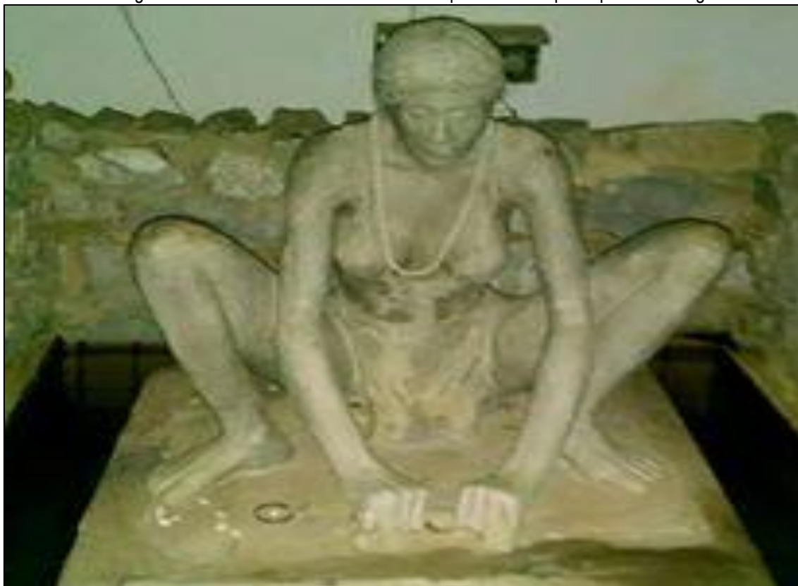
Figura 1: Estátua da lavadeira antes de ser paramentada pelos preceitos religiosos.