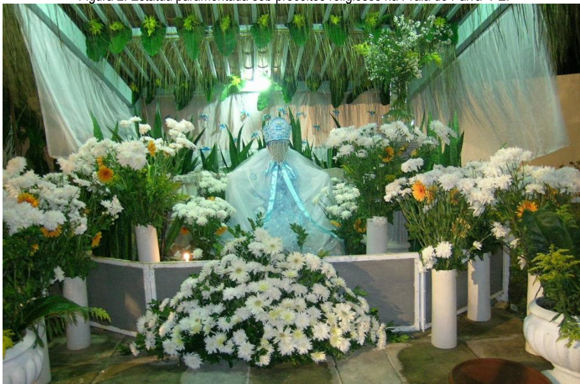
Figura 2: Estátua paramentada sob preceitos religiosos na Praia do Paiva- PE.