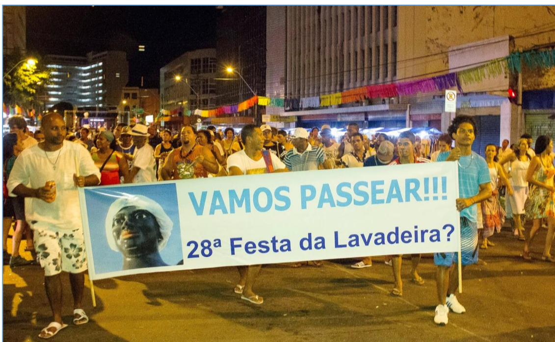
Figura 5: “Bairro de São José - Recife - 1 de maio 2014 - A Boneca da Lavadeira expulsa de Pernambuco, decide passear procurando a sua Festa da Lavadeira”- Legenda colocada no site da festa