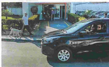
De carro, Laureci reclama do local das faixas de pedestre