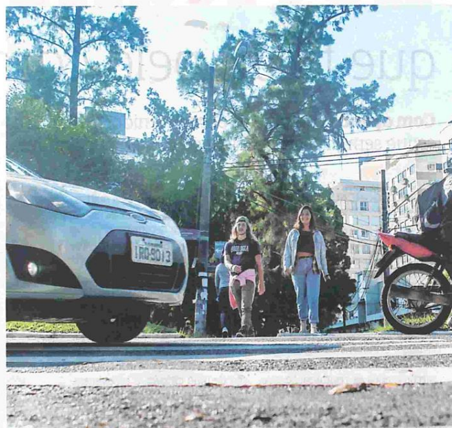
Fluxo intenso de veículos dificulta a travessia de pedestres

linhas de ônibus circulam nas imediações da universidade; apenas a linha UFSC transporta 22 mil pessoas por dia