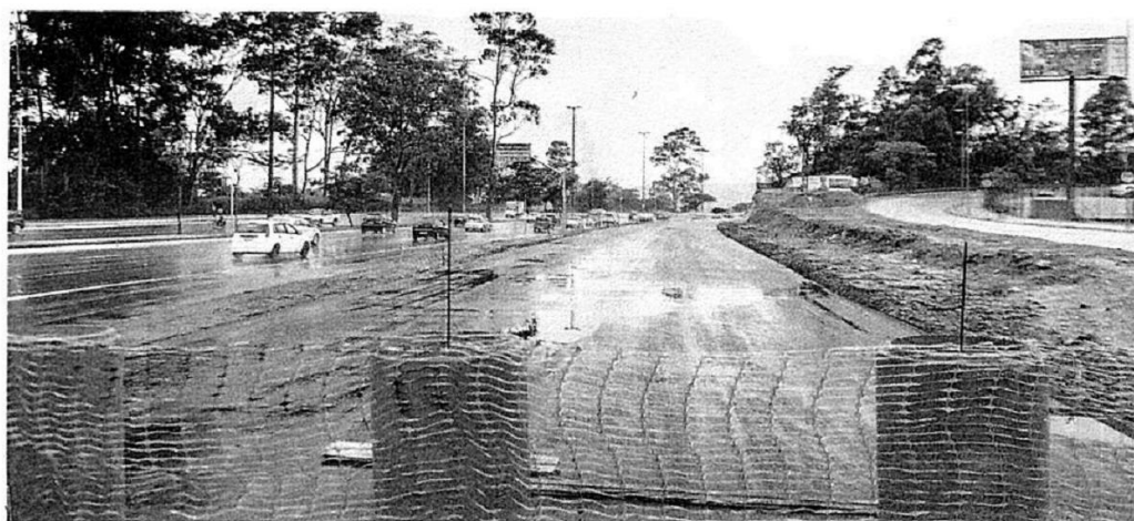
Agrônoma. Marginal da avenida Beira-Mar Norte está sendo pavimentada