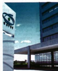
Recurso liberado garante o início das aulas que estava ameaçado

A universidade afirma que o adiamento das aulas se deu por falta dos repasses e assim que eles forem confirmados a situação será normalizada. O início das aulas estava previsto para o próximo dia 26 de fevereiro, data que pode ser mantida com