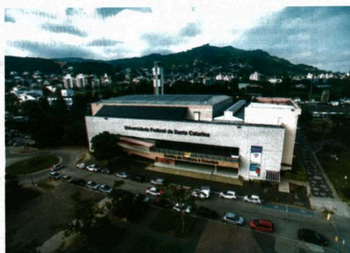
Universidade é alvo de inspeção correcional extraordinária