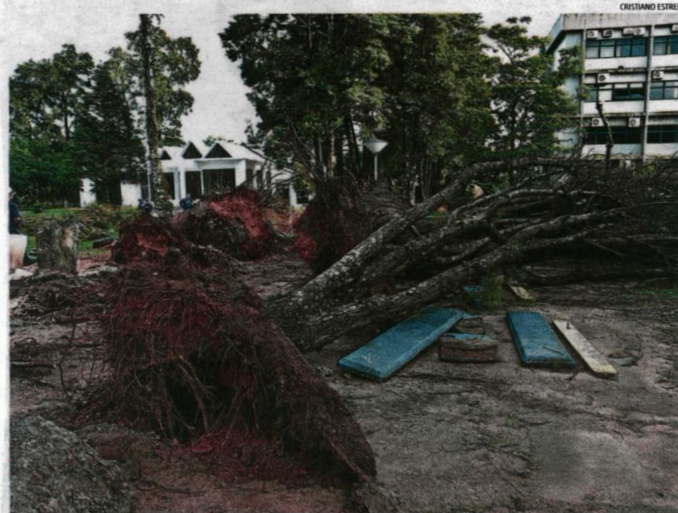
A forte chuva que atingiu Florianópolis na última terça-feira derrubou 10 árvores no campus da UFSC

individual será de até R$ 6,2 mil, desde que o trabalhador tenha este saldo disponível no fundo. Depois que toda burocracia for cumprida, o morador poderá solicitar o depósito à Caixa até 90 dias depois do reconhecimento federal da situação de emergência, que ocorreu em 22 de janeiro.