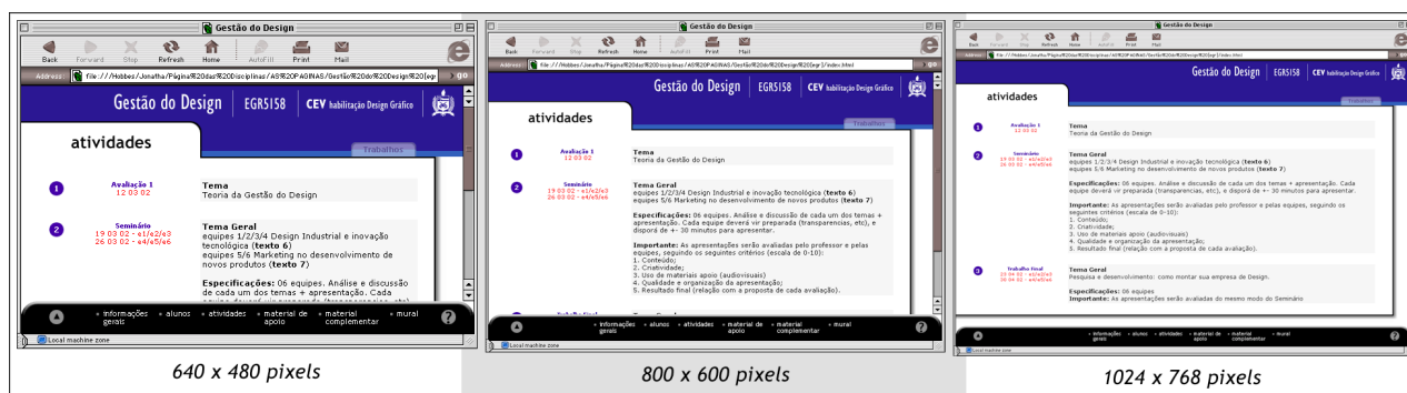
Figura 5: Página protótipo em diferentes dimensões.

Para assegurar a compatibilidade com softwares foram feitos testes em plataformas Mac e PC com os navegadores Microsoft Internet Explorer e Netscape , para ambas plataformas, o que acarretou algumas modificações na confecção da página protótipo.