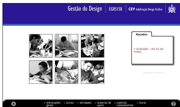
Figura 4: Homepage ou página inicial.

No caso da disciplina de Gestão do Design foram trabalhadas imagens dos alunos realizando atividades em sala de aula – ver figura 4. Assim, ao entrar na página da disciplina o aluno já tem um elemento de familiaridade que o introduzirá ao conteúdo das páginas do website e à própria disciplina.