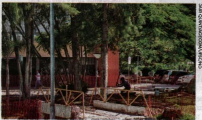
Obras em andamento próximo ao prédio da Reitoria da UFSC