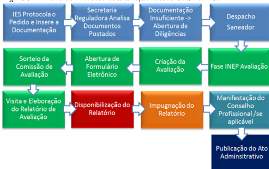
Figura 02 – Fluxo do Processo de avaliação in loco do SINAES.