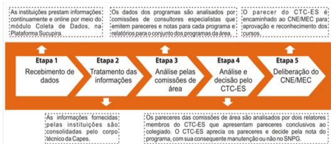
Figura 04 – Permanência no SNPG: Avaliação Trienal.

Fonte: Portal CAPES. Permanência no SNPG: avaliação (BRASIL, 2014)