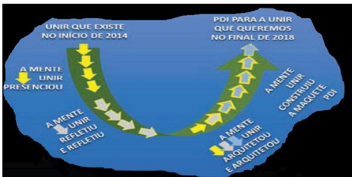
Figura 1 - Tecnologia Social para Soluções Sistêmicas – Teoria U