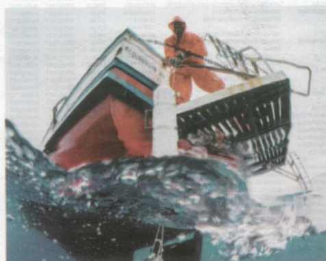
Pesquisadores flagraram variações de temperatura da água