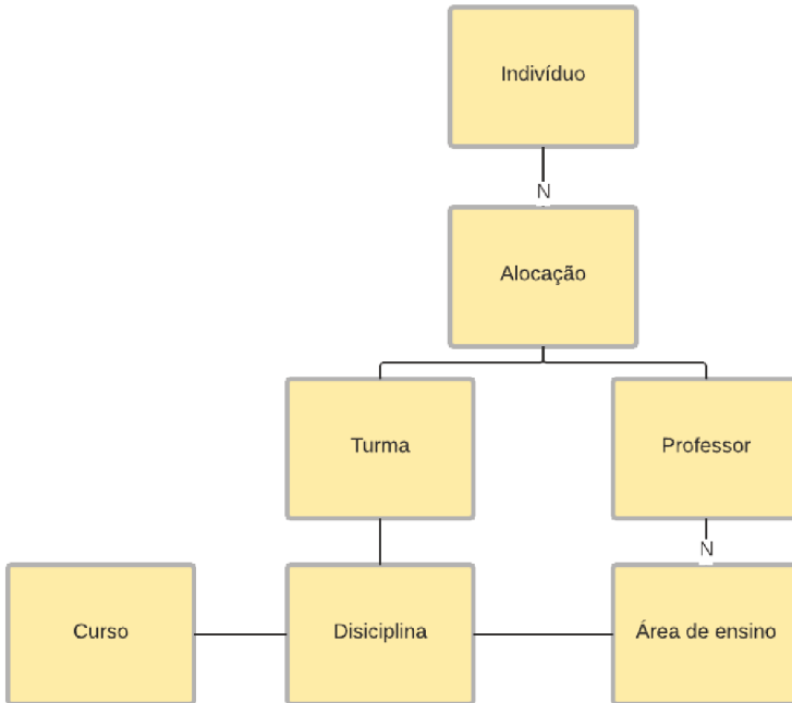
Figura 7 Modelo do algoritmo.

Cada objeto da classe Curso possui os atributos: codigo (String); nome (String); periodo (Enum com dois valores possíveis: INTEGRAL ou NOTURNO); fases (Integer).