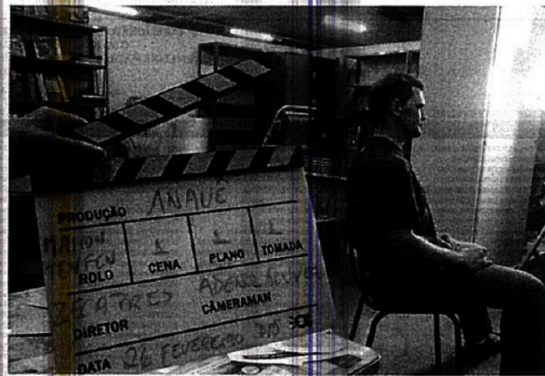
Documentário "Anauê", de Zeca Pires, fala do nazismo e do integralismo no Vale

O FAM 2017 terá ainda a mostra infanto-juvenil, mostra paralela de música, exposições de curtas catarinenses e a mostra Doc-FAM.